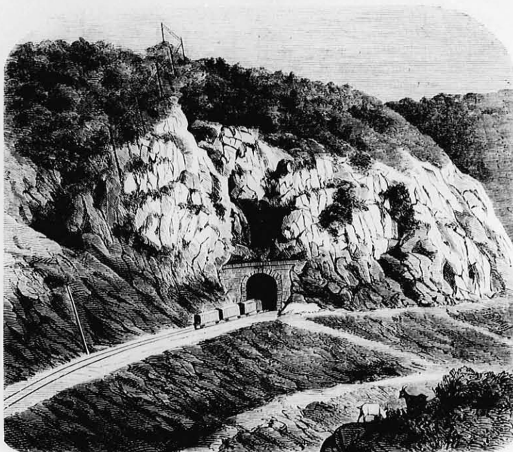
N.-várad-kolozsvári vasút. VIII. A harmadik alagút.

s a nélkül, hogy a társadalomnak véres forradalmakon kellene áthatolnia, a nélkül, hogy a tökebirtokosok pénze elraboltnék, lassankint eljő az idő, midőn törvény fogja kimondani, hogy a bérmunka meg van szüntetve, s ezentul csak vagy magánmunka, vagy szabad produktív-társulat engedtetik meg. Az utolsó rabszolgaság megszün-