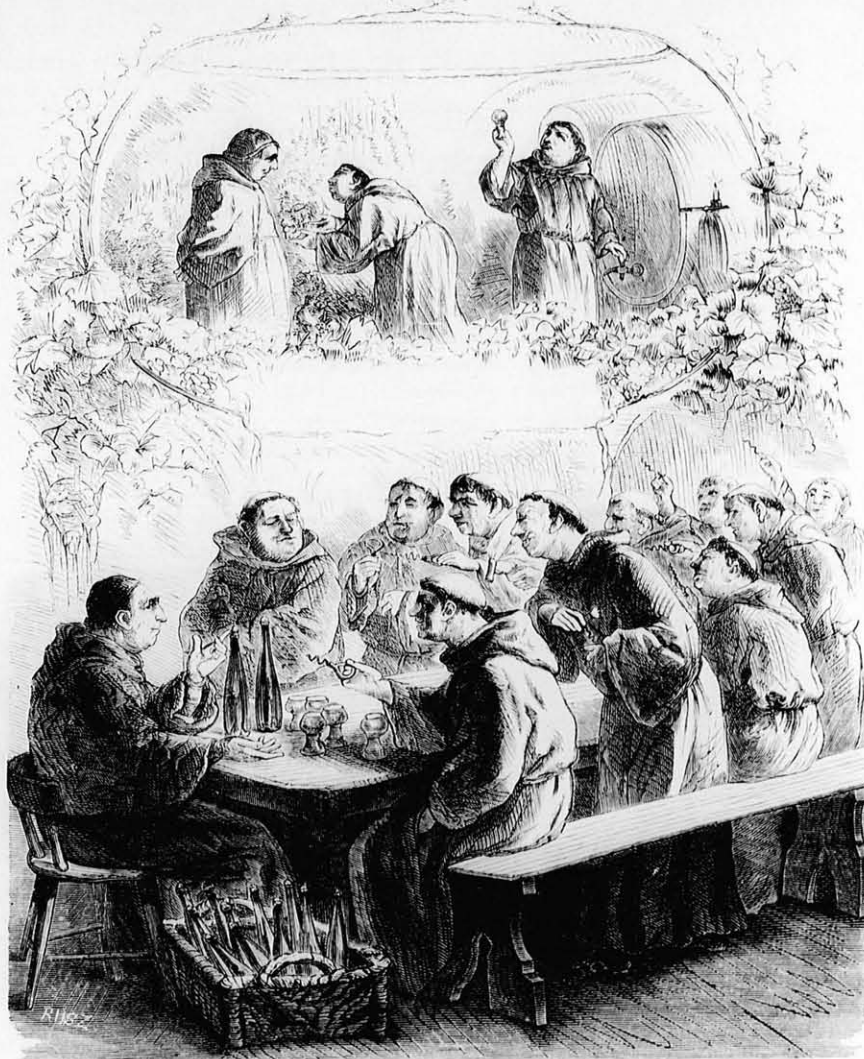
A johannisbergi barátok.

Míg az első görög bölcseszek szerint a khaosz volt a világnak alapja: Thales (632 Kr. e.) a vizet, Anaximander (615 Kr. e.) a végtelent, Anaximenes (548 Kr. e.) és Diogenes a levegőt tekintették annak. Először Heraklit (500 Kr. e.) tért vissza a régi ind nézethez s tette a tüzet a mindenség elsőlévő Anaxagoras (501 Kr. e.) szerint az anyag volt az örök, az ősprincipium. Hűvös és meleg váltak el Archelaos (450 Kr. e.) szerint mint első létel az örök szellemből. Xenophanes (600 Kr. e.) vizet és földet vette föl a dolgok alapeleméül. Iskolája ellenében Empedokles (460 Kr. e.) hozzátette még a levegőt és tüzet is. Magában az ideális attikai iskolában is, mely virágzásának tetőpontját Platon (429—348 Kr. e.) érte el, azt tanították, hogy a világ tűz- és földből teremtetett, víz és levegő által pedig egyesítettet. Legnagyobb tanítványa, Aristoteles (384 Kr. e.) e négy elemhez hozzá-