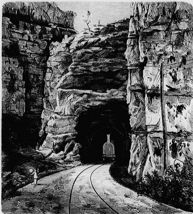
N.-várad-kolozsvári vasút, III. Az első alagút Rév és Brátka közt. (A kolozsvári oldal)

Volt idő, midőn azt hitték, hogy a tüzet megszenteltlenítik és megtisztaltatják, ha azt házi és műtani célokra használják. Ezen idő, természetesen, nem lehetett más, mint az, midőn a tűzimádás virágása tetőpontján állott, midőn a tüzet isten gyanánt tisztelték. Ezért tartatik (Duncker szerint) Iranban nagy érdemnek a tüzet a műhelyekből, főleg minden szerteszét található égszt a szent tűzhelyekre vinni. Vették volt a tüzhely tüzet nagyon a ház igéncyire használni, azt épen nem, vagy rosszul táplálni s zöld, ki nem száradt, jól össze nem vagdalt, ki nem próbált fával és illatokkal, szájjal szítani vagy eloltani; a tűzbe vizet önteni vagy azt tisztátalan kézzel megérinteni. Legnagyobb bűn volt pedig tisztáltant vagy épen valami csettelen hullát a tűzbe dobni és az által a tiszta elemet: Ahuramasa — nap — fiát megtisztaltantani. Az olyan bűnökért, melyek tudatlanságból vagy figyelmenlenségéből követték el, a tüztől boesánatot kellett kérni. A parzok még most sem fújnak el semmi világot, hanem eloltják a kéznek lobogtatása által, vagy pedig a tüzhelyre viszik; a tüzvész is nem vízzel oltják, hanem az épületeket leszagatják és a gerendákat eltávolítják, vagy pedig földnek ráhányása által fojtják el. A hol ilyen nézet uralkodott, ott természetesen műiparra gondolni sem lehet a mi fogalmunk szerint. Az efféle kultusz a szennyes barna- és kőszénnek használatát egyenesen elzárta, még ha úgy ismerték volna is, mint napjainkban. Egyetlen állattal esontot sem égethettek volna el