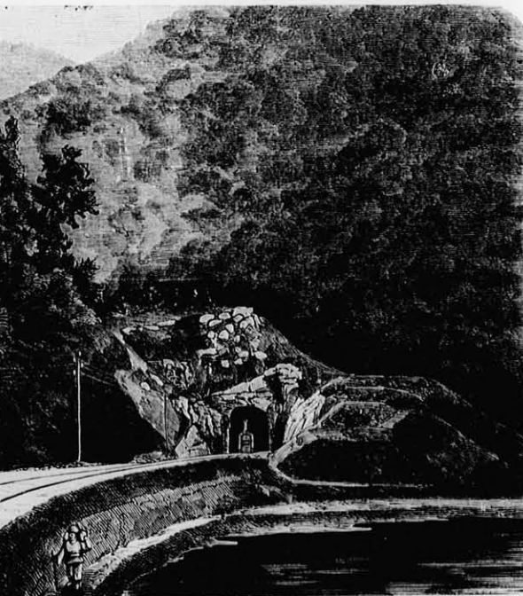
N.-várad-kolozsvári vasút IV. Ugyanazon slagut Nagy-Várad fölül.

De még Lavoisier sem értette meg az egészet. Nem sokára olyan vegyületeket is ismertek föl, hol az élenyt könnyű, halvány, bizonyos más anyag helyettesíti. Davy mely gondolkozása és a Volta-oszlop segítségével készült földfelezések után, csak Berzeliusnak sikerült 1819-ben minden vegytani elegyülés folyamatát villanyos processusra vinni vissza. Most már a vegytani rokonság