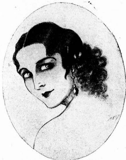
A wieni „Intern. Frisierkunst u. Mode“-ból átvéve.

Ha hiányzik az egyéni rátermettség, hiábavaló minden erőlködés, mert szellemet nem adhat az iskola, de mégis letagadhatatlanul nagy befolyással van a gyermekre azon idő, amelyet oktató felügyelete alatt gyermektársai körében tölt el, mert