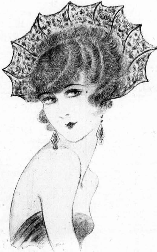
A wieni „Internationale Frisierkunst und Mode“-ból átvéve.