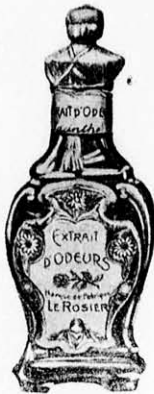
823. Husvéti parfóm tct. 96.000 K

Husvéti parfómök 6 drb egy dobozban minőségben