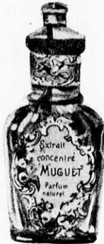
822. Husvéti parfóm tct. 84.000 K