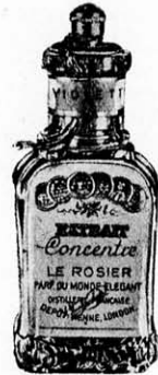
807. Husvéti parfóm tct. 72.000 K