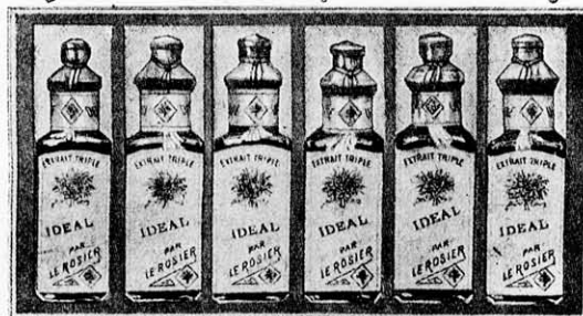
731. Husvéti parfóm