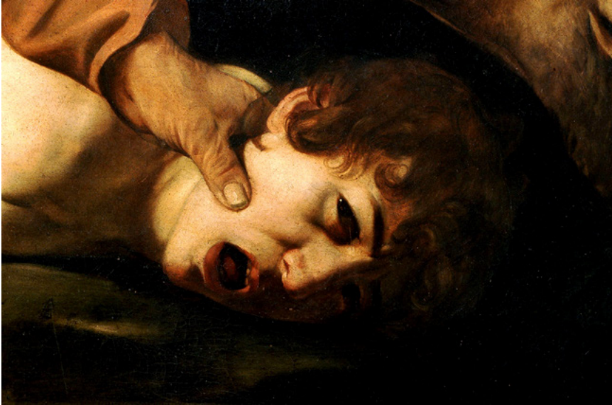
7b kép. Caravaggio: Izsák feláldozása, részlet