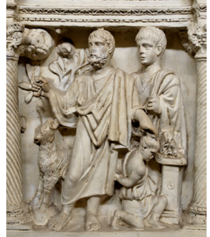
2. kép. Izsák feláldozása, Junius Bassus szarkofágjának részlete, kb. Kr. e. 359

„És lőn ezeknek utána, az Isten megkísérté 2 Ábrahámot, és monda néki: Ábrahám! S az felele: Ímhol vagyok. És monda: Vedd a te fiadat, ama te egyetlenegyedet , a kit szeretsz, Izsákot, és menj el Mórijának földére, és áldozd meg ott égő áldozatul a hegyek közül egyen, a melyet mondándok néked. Felkele azért Ábrahám jó reggel, és megnyergelé az ő szamarát, és maga mellé vevé két szolgáját, és az ő fiát Izsákot, és fát hasogatott az égő áldozathoz.