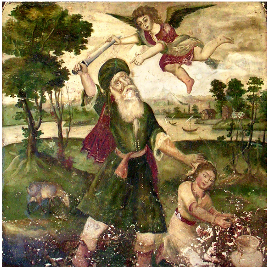
4. kép. Ibrahim, amint éppen fel akarja áldozni fiát (freskókép Sirázból)

Akkor kiálta néki az Úrnak Angyala az égből, és monda: Ábrahám! Ábrahám! Ő pedig felele: Ímhol vagyok. És monda: Ne nyujtsd ki a te kezedet a gyermekre, és ne bántsd őt: mert most már tudom, hogy istenfélő vagy, és nem kedvezél a te fiadnak, a te egyetlenegyednek én érettem. És felemelé Ábrahám az ő szemeit, és látá hogy imé háta megett egy kos akadt meg szarvánál fogva a szövevényben. Oda méne tehát Ábrahám, és elhozá a kost, és azt áldozá meg égő áldozatul az ő fia helyett. És nevezé Ábrahám annak a helynek nevét Jehova-jirenek. Azért mondják ma is: Az