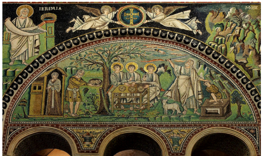
3. kép. Izsák feláldozása, mozaik, Ravenna, San Vitale-bazilika, Kr. u. 547

Akkor felkele és elindula a helyre, melyet néki az Isten mondott vala. Harmadnapon felemelé az ő szemeit Ábrahám, és látá a helyet messziről. És monda Ábrahám az ő szolgáinak: Maradjatok itt a szamarral, én pedig és ez a