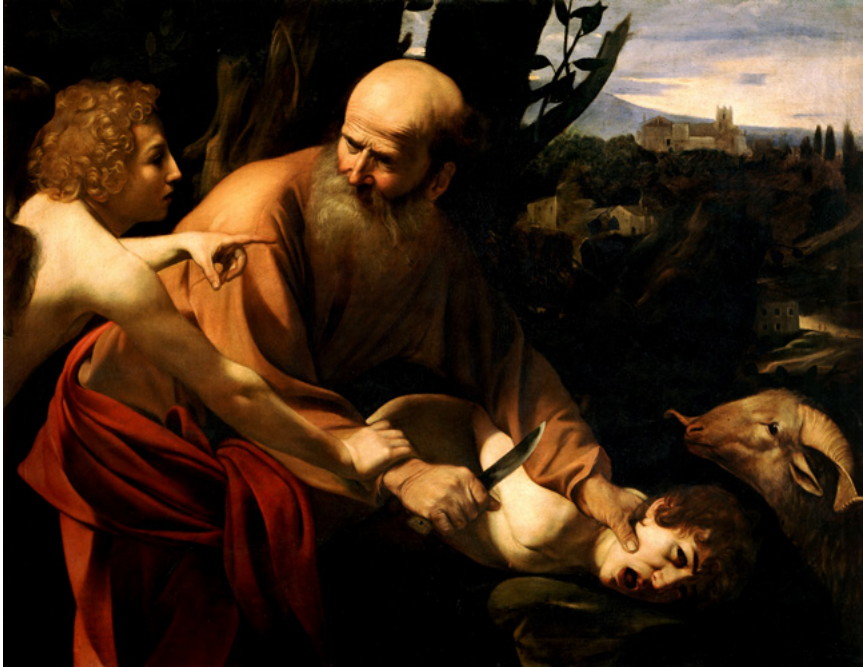
7. kép. Caravaggio: Izsák feláldozása, 1603, Firenze, Uffizi Galéria