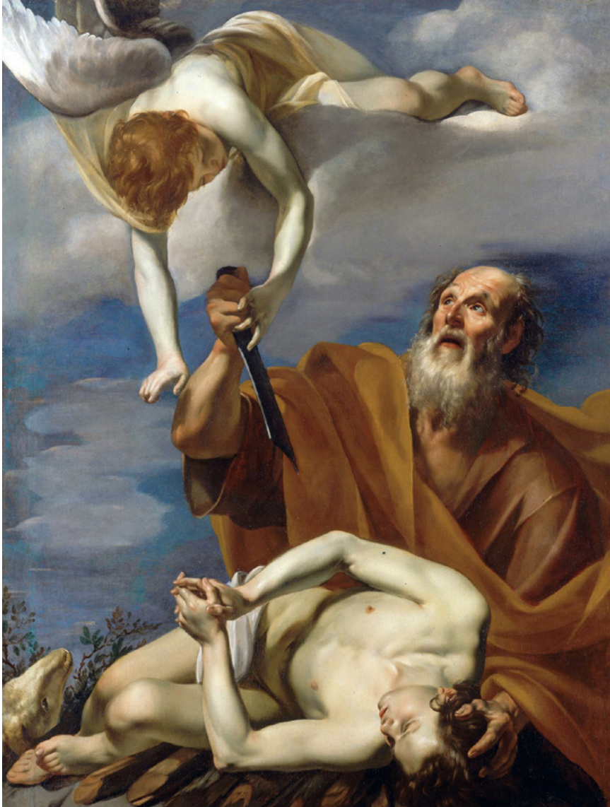
5. kép. Orazio Riminaldi: Izsák feláldozása, 1620 vagy 1630

Talán kedvét leli az Úr a kosok ezreiben, vagy az olajpatakok tízezreiben? Talán elsőszülöttem áldozzam bűnömért, drága gyermekemet vétkes életemért? Ember, megmondta neked, hogy mi a jó, és hogy mit kíván tőled az Úr! Csak azt, hogy élj törvény szerint, törekedj szeretetre, és légy alázatos Isteneddel szemben.” (Mik 6,6–8; kiemelés tőlem) Izsák sok tekintetben eltért a