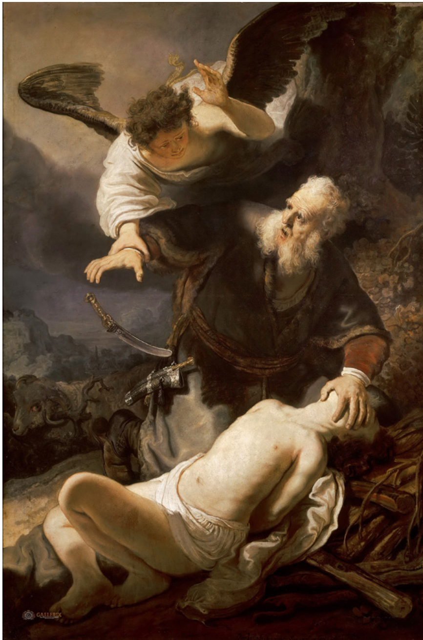
6. kép. Rembrandt: Izsák feláldozása, 1635, Szentpétervár, Ermitázs

Ravennában a San Vitale-bazilikában látható egy a 6. századi ábrázolás (3. kép.). Bal oldalon Sára a ház (sátor) bejáratánál gyanakodva figyel az égi vándorokat, akiket Ábrahám vendégül lát. Középen az ószövetségi Szentháromság alakjai, akikről Rubljov megfestette csodálatos ikonját. Végül jobb oldalon Izsákot láthatjuk az áldozati oltáron, előtte Ábrahám, akit a menyéből lenyúló kéz akadályoz meg abban, hogy fiát feláldozza. Ismeretes, hogy Izsák nevének jelentése nevetés. Amikor az égi küldöttek