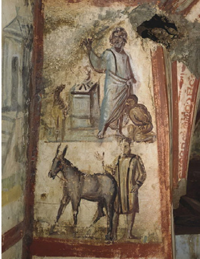
1.kép. Izsák feláldozása, Via Latina katakomba, Róma, 4. századi falfestmény

egy olyan pillanat, amikor szüleim majd felébresztenek az éjszaka közepén, és késekkel a kezükben azt mondják: »Isten szólt hozzánk, úgy-hogy most velünk kell jönnöd« – és a történetbeli angyal, aki az utolsó pillanatban megállítaná a kezüket, elkésik. Nem éppen a legszerencsésebb, amikor egy kisgyerekek ilyen dolgok jutnak eszébe a szüleiről.”