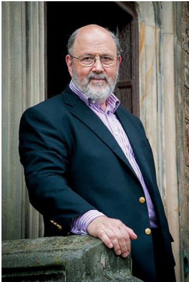
Nicholas Thomas Wright

tudomány eredményei lassan a rendszeres teológiába is leszivárognak.”