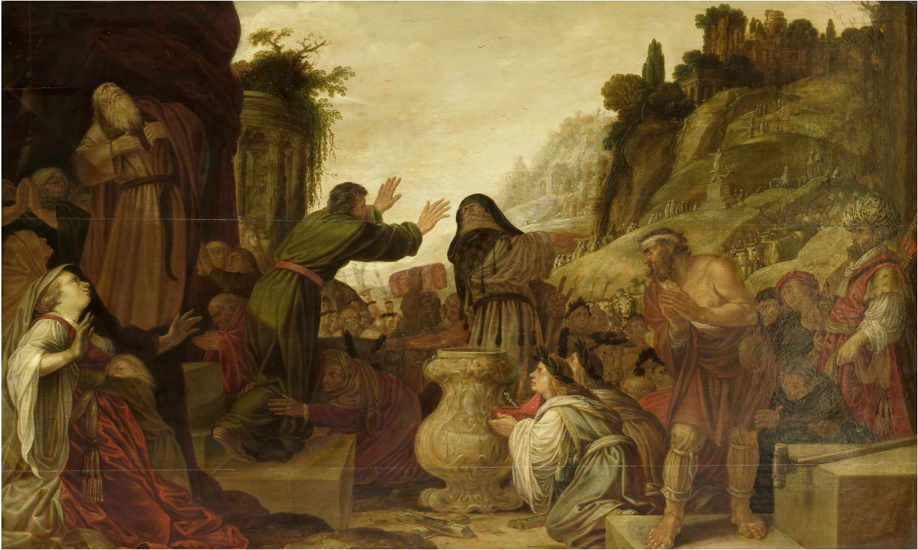
Jacob Pinas: Pál és Barnabás Lisztrában (1628)