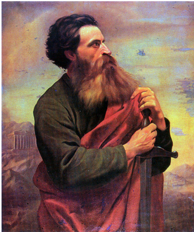
Jose Ferraz de Almeida Júnior: Szent Pál apostol (1869)

be. Beszél a megtérés és az elhívás különbözőségeiről, igazi jelentésükről; az evangélium szó félreértéséről, ami a modern egyházban tanítási és gyakorlati torzulásokhoz is vezet(ett), és Pál értelmezését messziről, a háttérrel kezdve fejti meg és fejti ki. Mindennek ószövetségi alapjául Ézsaiástól idéz (40,9; 52,7), érvel azok eredeti jelentéséből kifolyólag, és beilleszti az 1. századi politikai helyzetbe. Majd pedig a „négyféle evangéliumról” értekezik, ami alatt nem a Máté–Márk–Lukács–János leírását kell érteni, hanem hogy az „evangélium maga tulajdonképpen Jézus királyi uralmának meghirdetése” (50. old.). Ebben a megfeszített és a feltámadott Jézusról van szó, és Jézusnak király, illetve úr voltáról. Hogy miket jelentett ez Pálnak, a korabeli zsidóságnak és a pogányságnak (ez a fogalom szintén részletesen kifejtésre kerül), azt Isten evangéliumával azonosítja, és a fejezet végén összegzi is megállapításait.