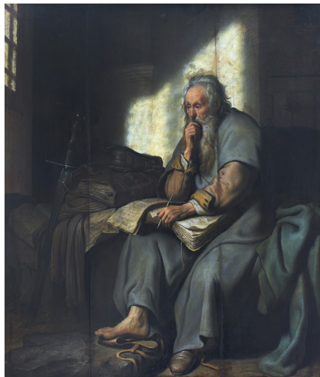
Rembrandt: Pál a börtönben (1627)

Könyvünk első két fejezetében ennek a páli életcélnek a kialakulását mutatja be a szerző. Először jelentős teológusok Pál-kutatásait tekinti át, amelyek meghatározták a mai Pál-képet. Már Albert Schweitzer feltette a két alapkérdést: Vajon Pál zsidó vagy inkább görög gondolkodó volt-e? Mi volt Pál teológiájának a középontja? Ezekből fakad egy harmadik kérdés: Mit jelent Pál a mai embernek? Rudolf Bultmann Pált (János mellett) az egyik fő oszlopként és hellenistaként mutatja be Az Újszövetség teológiájában . W. D. Davies szerint Pál olyan zsidó rabbi volt, aki Jézusban mint a zsidók Mesiásában hitt. A következő jelentős tudós Ernst Käsemann, aki szerint Pál kifejezetten zsidó kontextusban fogalmazta meg a judaizmus kritikáját. A szerzőhöz ez a nézet áll legközelebb. A legmeghatározóbb tudós pedig a szerző egykori oxfordi kollégája, E. P. Sanders, akinek kutatásai forradalmasították a Pálról szóló tudományos közbeszédet. Ő széles háttérrel vizsgálta Pál korának palesztinai zsidóságát, abba beágyazottan tárta fel Pál teológiáját és a törvényhez való viszonyát („szövetségi törvényvallás”). Az irányzatok bemutatása után négy területen vet fel mai kérdéseket a szerző: a történelem, a teológia, az exegézis és az alkalmazás területén. Itt is megfogalmazza a könyv célját: „elhatárolódnunk a Pált félreértő interpretációktól, hogy megértsük: Pál maga hogyan szeretné, ha őt értelmeznénk.