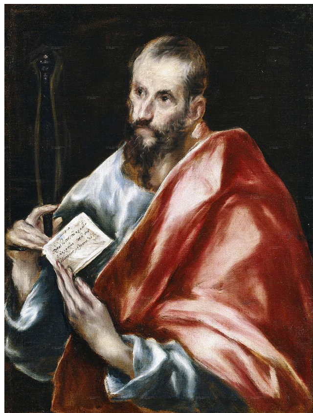
El Greco: Szent Pál (1614)