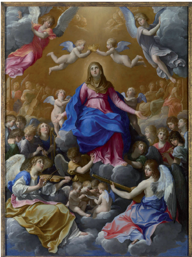
Guido Reni: Mária koronázása, 1607

A katolikus teológia szerint Mária különleges tiszteletet 20 érdemel: jogosan jár neki a hódolat és a hála az üdvrendben játszott szerepéért. Egy magyarázat 21 szerint Máriában hüposztatizált a Szophia (nőnem), ahogy Jézusban megtestesült a Logosz (hímnem). Ezért a 12. századtól elterjedt az a nézet, hogy Mária mennybe emelkedése után a Fiú vagy a Szentháromság vagy az angyalok megkoronázták, 22 és ezzel a menny uralkodónőjévé tették a Szent Szüzet. Ő lett így a „ Complementum Trinitatis ”, a Szentháromság kiegészítője. Következésképpen a szentek tiszteletének egyházi gyakorlata ( dulia ) alapján Máriához is fohászkozhatunk ( hüperdulia 23 ) és kifejezhetjük tiszteletünket, ami „a keresztény lelkiség jó és hasznos eleme” – a Lumen Gentium 24 szerint.