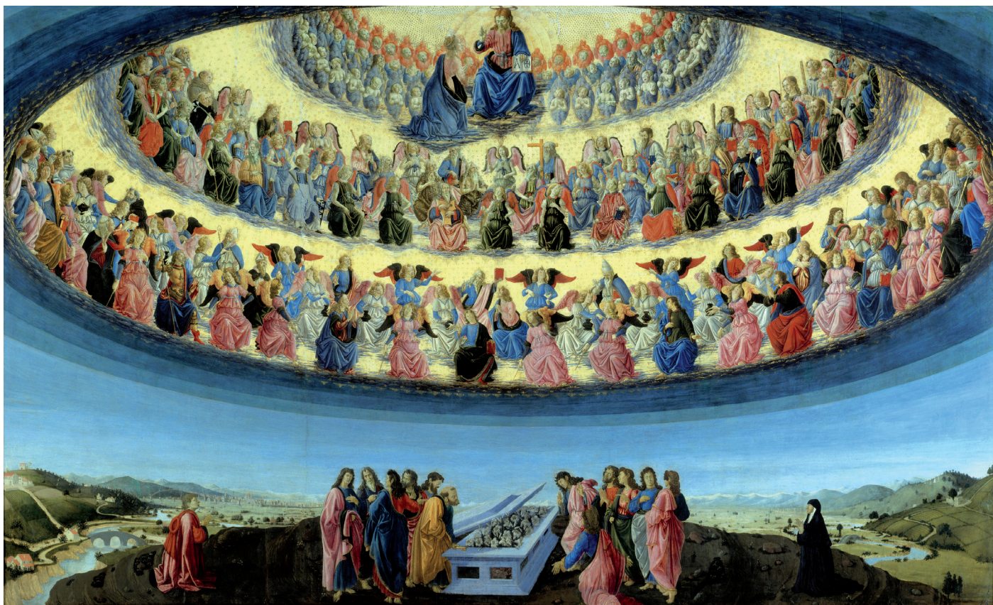
Francesco Botticini: Mária mennybevétele, 1475–1476