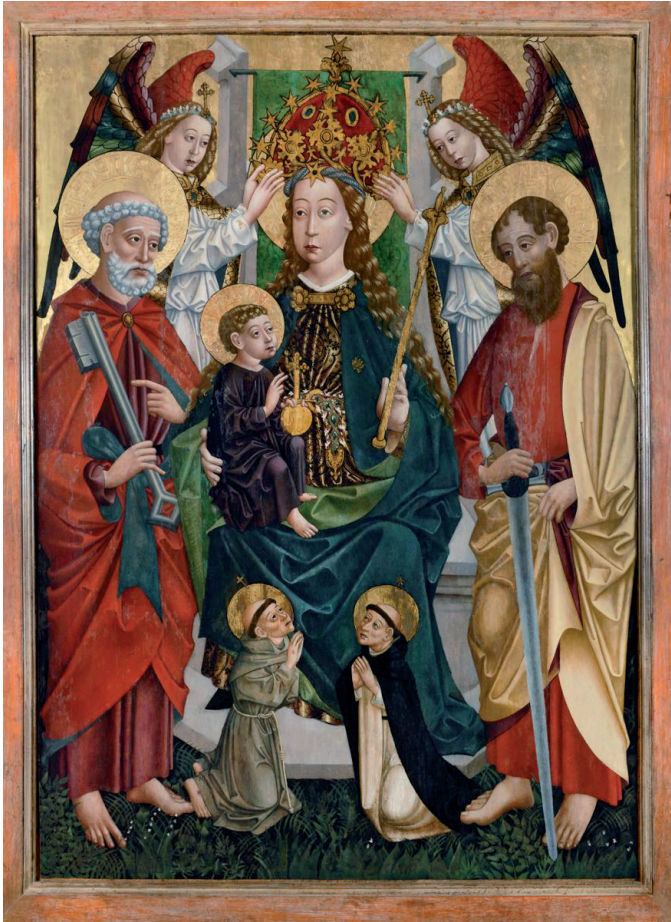
Trónoló Madonna Szent Péter és Szent Pál, valamint Assisi Szent Ferenc és Szent Domonkos ábrázolásával. A csiksomlyói Szent Péter és Pál-templom egykori főoltárának középképe, 1480

sőt az angyalok méltóságát. 29 „A Maria regina (Királynő) ábrázolásokon Mária trónon ül, fején drágakövekkel v. gyöngyökkel ékes korona, az Istenfiú az ölében v. külön trónon... 30