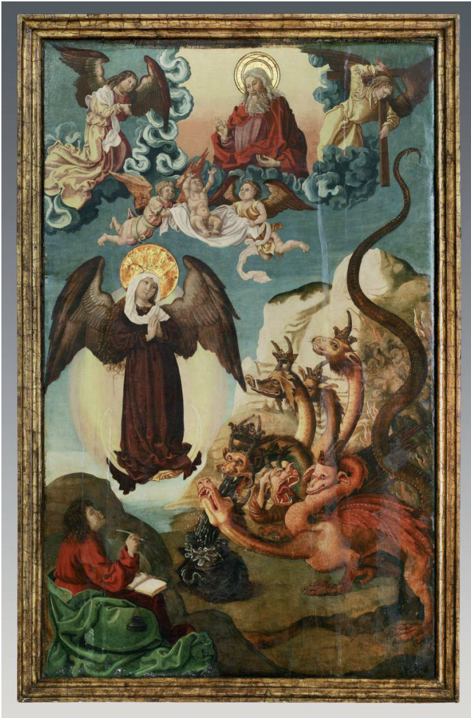
Szent János evangélista látomása a napba öltözött asszonyról, oltárszárny hétköznapi oldalának részlete, Szentbenedek, 1510–1520

Marianum koncepció belső fejlődése jól nyomon követhető a képzőművészetben. Ábrázolásában lényegében a napba öltözött asszony stíluselemei olvadtak össze a Magyarok Nagyasszonyának hagyományos középkori ikonográfiájával. 24