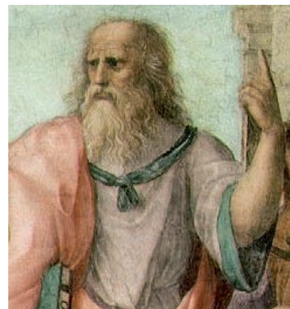
Platón (Raffaello festményének részlete, 1509)

Ezek az emberek nem önszántukból kerültek ebbe a helyzetbe. Az emberiség a bűn miatt került Istentől távol. A sátán az, aki rákényszerítette akaratát az emberekre, belevitte őket a bűnbe, megkötözte és ebben az állapotban tartja őket. Nyomorult emberek, akik a saját erejükből képtelenek kiszabadulni ebből a helyzetből. A láncok, a bilincsek nem engedik őket még mozogni sem. Mivel még soha nem voltak máshol, nem is tudják, hogy van másféle élet is.