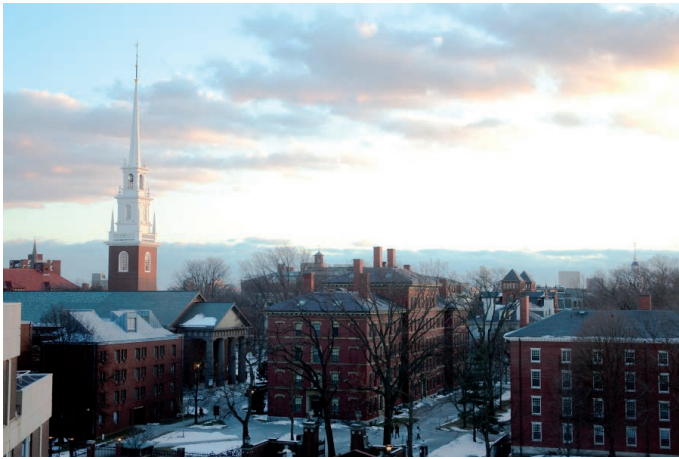
A Harvard egyetem napjainkban

madárra utal levelében, amely időnként újjászületik hamvaiból. Ez a madár később beépült a keresztény irodalomba és vallásos gondolkodásba. A keresztény atyák elutasították a lélekvándorlás elméletét, de elfogadták a lelkek halhatatlanságáról szóló felfogását.