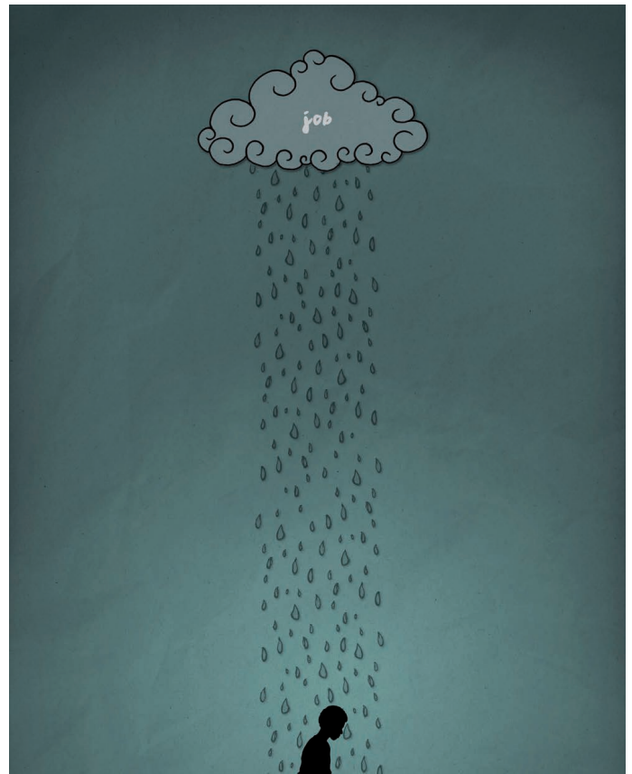
Jób könyve (Jim LePage illusztrációja)

Más érvek is vannak, hogy miért érdemes igéket memorizálni. Remélem, hogy a gyakorlatban fogod ezeket megtapasztalni.