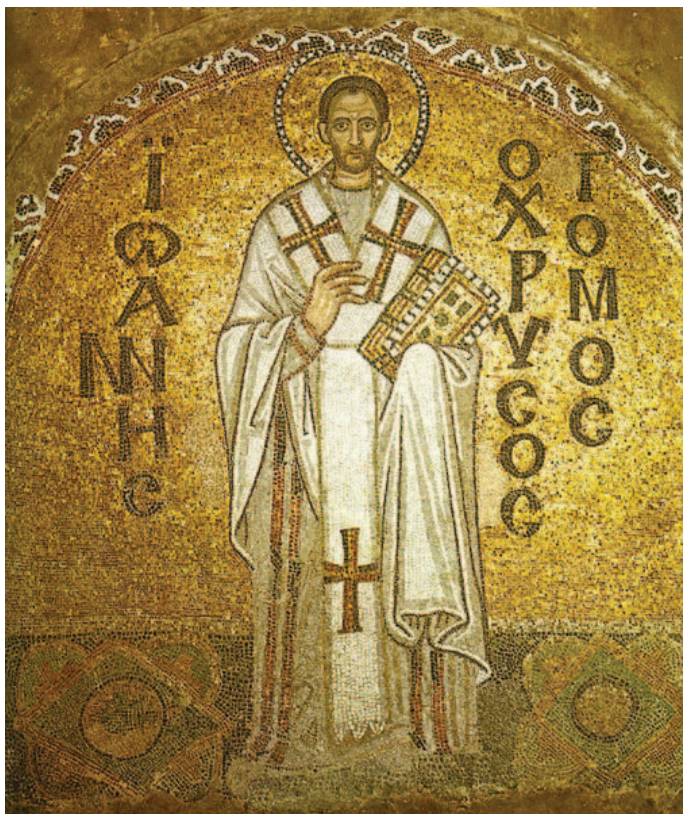
Aranyszájú Szent János