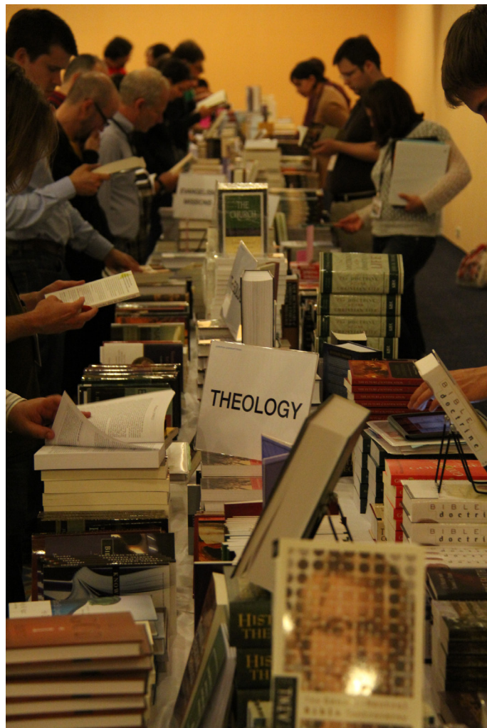
Teológiai könyvek széles választéka volt elérhető, kedvezményesen

például a homoszexuálisok közötti házasság legalizálása és ehhez hasonló. Jó volt érezni az óvó szeretetet részükről. Itt valóban megszűntek a határok, és ami mindnyájunkat összekötött, az a Krisztus és az ő országa iránti szeretet. Ezt az egységet éltem meg Isten egy humoros ajándékában is. Saját szekciómban, melyről alább még szólok, megismerkedtem egy fiatalemberrel, akiről lassacskán kiderült, hogy az első bukaresti román baptista gyülekezet segédlelkésze, mely gyülekezet kezdetben német gyülekezetként működött. Ezt követően rajtam volt a sor a bemutatkozást illetően, amikor is elmondtam, hogy az első magyarországi, és egyben budapesti magyar baptista gyülekezet segédlelkésze vagyok, mely gyülekezet kezdetben német gyülekezetként működött. A kapcsolat innentől önálló életre kelt, és egyszer csak egy autóban találtam magamat négy román fiatalemberrel együtt, amint épp a román–magyar helyzetről beszélgetünk a legnagyobb békességben. Ilyen helyzeteket csak Krisztus tud összehozni és menedzselni.