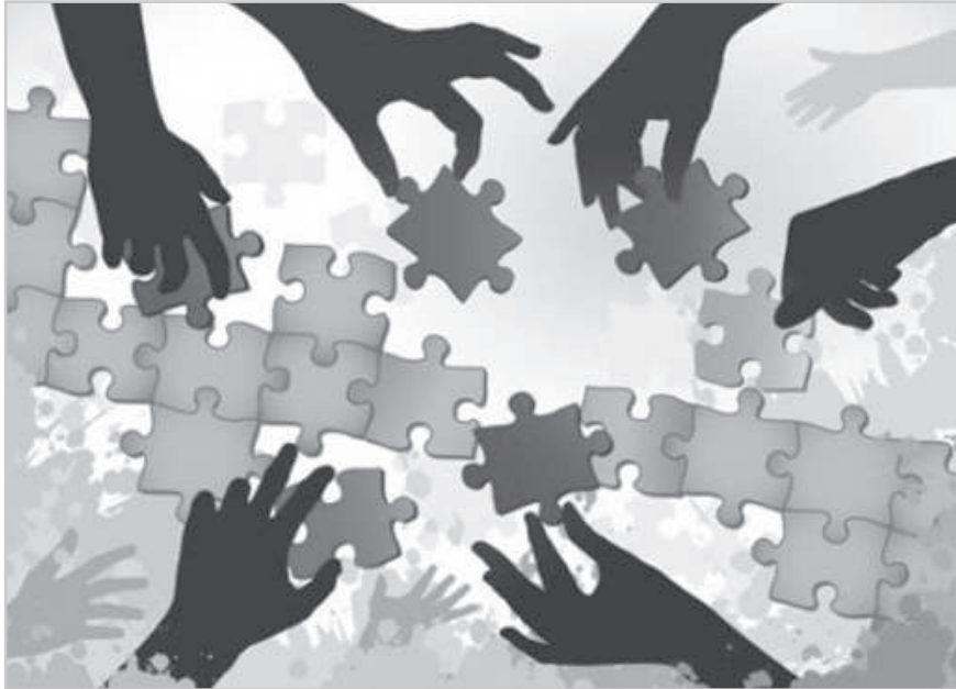
A do ut des elvének gyakorlása helyett látnunk kell, miként illeszkedhet adományunk a gondviselés isteni tervébe

szabad üres kézzel elbocsátani. Az Úr ezt kitágítja és egyáltalán az adakozás etikájává teszi. Méghozzá a viszonzást nem váró adakozás etikájává. Itt azonban úgy kerül interpretálásra, mint egy befektetés a mennyei bankba: „adj, és biztosan visszazár rád!” A do ut des elve nem új keletű. Már az Ószövetség idején hamis indítékként van feltüntetve, lásd Jób könyvét. Ha igaz lenne, hogy a gazdagság volna Isten egye-