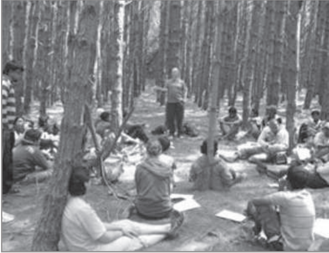
Indiai ifjúsági missziói tábor képkockái

jelent a külmisszió: az úgynevezett „pogány népek” keresztyén hitre térítésének szándéka, amely elsősorban az apostoli korban, valamint a pietizmus és az angolszász ébredési mozgalmak után vált közkeletűvé. Lásd William Carey indiai vagy Hudson Taylor kínai munkásságát, és az annak következtében sorra-rendre alakuló külmissziói társaságok működését.