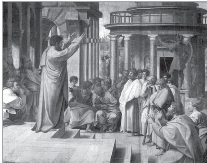
Raffaello: Pál prédikál az Areopágoszon

mény mennyire hasonlít napjaink fórumaihoz, kerekasztal-beszélgetéseikhez, a demokratikus konszenzushoz. Ütköznek a vélemények, az érdekek a parlamentben, és egy falusi kis gyülekezetben. 2 Mennyi üres fecsegés fársztó élménye van mögöttünk! Utóbb a döntés, nagy fogadkozásokkal. Végül a megvalósulás, amiről szó sem volt.