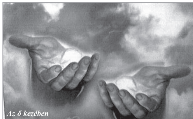
Az ő kezében

2 Pedig más lenne, ha ketten egyetértének a földön mind abban, amit kérnek (Mt 18,19)!