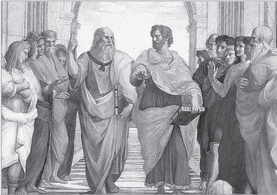
Raffaello Santi: Platón és Arisztotelész

A régebbi „járnak” kifejezés egy ókori felsőoktatási módszerre utal. Nem voltak akkor tantermek, nagyon személyes volt az oktató és a tanítványai közötti kapcsolat. A felsőfokú képzés ellenértéke nem a pénz, hanem a választott tanító tanácsainak követése volt a legnemesebb „csereérték”. Platón , az akadémiai szintű tanító beszélt egy Athén közeli ligetben, 10–12 fiatal férfi körében, olykor ülve, máskor sétálgatva eszmecserét folytattak. A tanítványok választották a bölcseset, nem egy felsőbb szerv jelölte ki. Amikor megjelent, körülfogták. Egy ókori ábrázolás mutatja a jelenetet. Ha sétáltak (görögül peripateó ), akkor is körülvették, s mindenkinek rászegződött a szeme. Együtt voltak, tanultak, követték a tanítójukat.