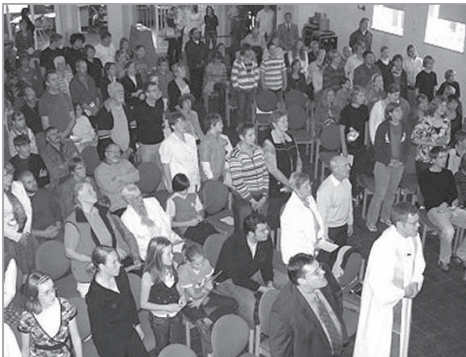
Generációk a gyülekezetben

Hogy sajnós az evangéliumnak nevezett gyülekezeteket is mennyi jogos vagy annak vélt vád érte és éri napjainkban is a nem egészen tiszta vagy nem egészen tisztának vélt pénzkezelés, vagy egyenesen az anyagiasság miatt, az nem tartozik ránk. De a bibliai norma, a gyanú felett álló pénzkezelés igen (2Kör 12,16).