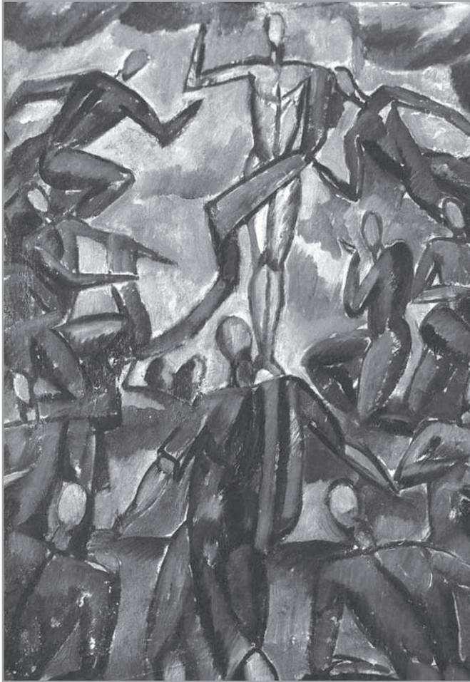
Kmetty János: Mennybemenetel

(Részlet „Az üdv üzenete” prédikációiból)