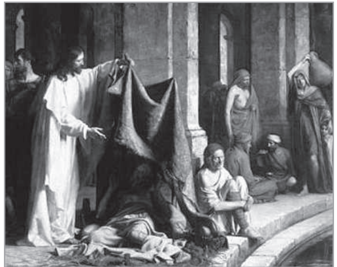
Carl Bloch: Gyógyítás a Bethesdánál

1. Minden, aminek nincs határozott rendszere és kötött ideje, az esetleges és egyúttal valószínű. A valószínű nem lehetetlen, nincs kizárva, de gyakorlatilag mégis csekélyebb az esélye annál, ami meghatározott idejű és rendszeres. Az újszövetségi esetben a történet valószínűsége annyira csekély, mintha nem is fordulna elő soha. Az ószövetségi „időnként” bizonyára gyakoribb. Szintén emellett szól a pénzkezelés gyakoribb szükségszerűsége. Csakhogy egy olyan esetben, mint a gyógyulás vagy a betegség tartós fennmaradásának fájdalmas kockázata, semmi sem versenyezhet a sürgősségben. Nem bízhatja magát egy beteg az esetlegességre, mert esetleg hiába vár rá. Az ószövetségi esetben bizonyára várhatóbb, talán gyakoribb, akár az áldozathozatal, akár a gazdasági felhasználás lehetősége, vagy annak kontrollálása. Mindez emberi, valós; míg a másik emberfeletti és esetleges. Mindenképpen előfordul, és jelen van a gyógyfürdőben. És minden egyes szenvedő betegnek nagyon fontos. Az ószövetségi esemény szokványos, kevesebb a körülötte lévő csodálatos titok, bár a folyamatosság, az mégis hiányzik. Egészen röviden tehát, nagyon más az, ami alkalmilag történik; és egészen más az, ami rendszeresen megtörténik. Egy szenvedő embernek összehasonlíthatatlanul fontosabb a gyógyulás, mint a pénzsámlálás.