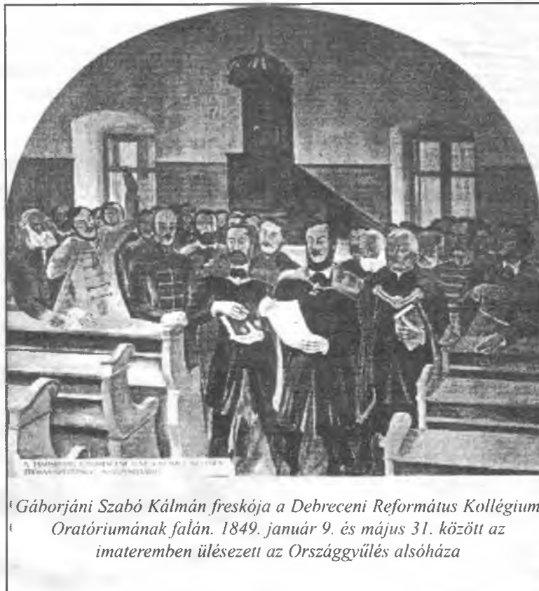
Gáborjáni Szabó Kálmán freskója a Debreceni Református Kollégium Oratóriumának falán. 1849. január 9. és május 31. között az imateremben ülésezett az Országgyűlés alsóháza

Az Esti Lapok Debrecenből búcsúzó cikkében úgy írt a városról, mint ahol végig józan légkör uralkodott, a nép utcai