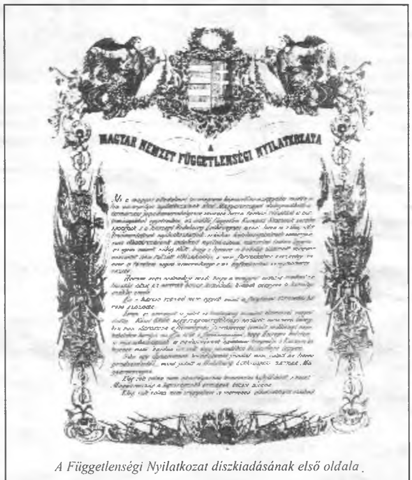
A Függetlenségi Nyilatkozat díszkiadásának első oldala.

A Függetlenségi Nyilatkozat szükségszerűségének a jog, a hazafiúi kötelesség, a hadsereg érdekeit figyelembe vevő méltányosság, a magyarországi katonai helyzet szempontjai és Európa politikai viszonyait mérlegelő indoklása után Kossuth öt pontból álló indítványt terjesztett a képviselők elé. Ennek első pontjában az Erdéllyel, valamint a hozzátartozó részekkel és tartományokkal együtt osztatlan területi egységet alkotó Magyarország önálló és független európai állammá nyilvánítására tett javaslatot. A második pontban a hitszegő Habsburg-Lotharingiai ház