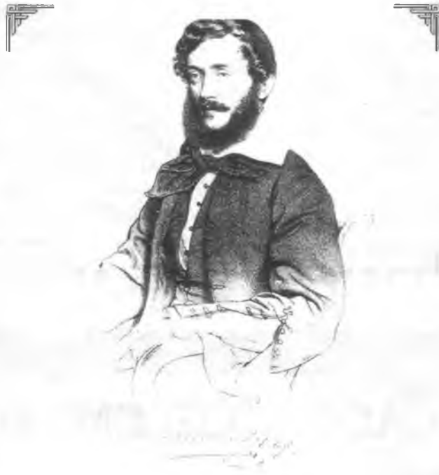
Kossuth Lajos (1802–1894) (1847-ben Pest megye követe az országgyűlésen; a Batthyány-kormány pénzügyminisztere, majd a Honvédelmi Bizottmány elnöke, s a Habsburg trónfosztás után kormányzó-elnök.)

Debrecenbe az országgyűlés nem a Függetlenségi Nyilatkozat szellemével érkezett, éppen ellenkezőleg, az uralkodócsaláddal való megegyezés készségével. Elsők között várták annak a küldöttségnek a híradását, amelyet Batthyány Lajos javaslatára Windischgrätz tábornagyhoz küldtek a „békés kiegyenlítés” érdekében. A jelentés január 12-én érkezett Debrecenbe, és másnap került az országgyűlés elé. Windischgrätz nem hagyott kétséget afelől, hogy sem fegyvernyugvásról, sem bármilyen egyéb egyezkedésről szó nem lehet, hanem egyedül csak feltétlen alávetésről (unbedingte Unterwerfung). Az országgyűlés tagjai különböző következtetéseket vontak le a küldöttség jelentéséből. A radikálisok a tábornagy válaszából minden további alkudozás és a békés megegyezés lehetőségének teljes megsemmisülését vezették le. A formálódó békepárt viszont nem akarta elvágni a megbékélés útját, és szükségesnek találta a küldöttség megbízásának további fenntartását.