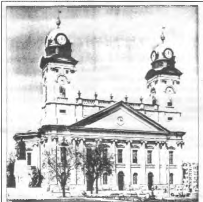
A klasszicista stílusú Debreceni Református Nagytemplomban közfelkiáltással fogadták el a Függetlenségi Nyilatkozatot

A Habsburg-Lotharingiai-ház trónfosztása előtti napok történései: március 30-án Kossuth jelenlétében tartott egri haditanács Klapka György vezérnagy tervei alapján kidolgozza és elfogadja a honvédség ellentámadásának tervét. Április 6-tól kezdődő támadásban Görgey főparancsnoksága alatti I. (Klapka), II. (Aulich) és III. (Damjanich) hadtest Isaszegnél megveri Schlick és Jelačić egyesült hadtesteit