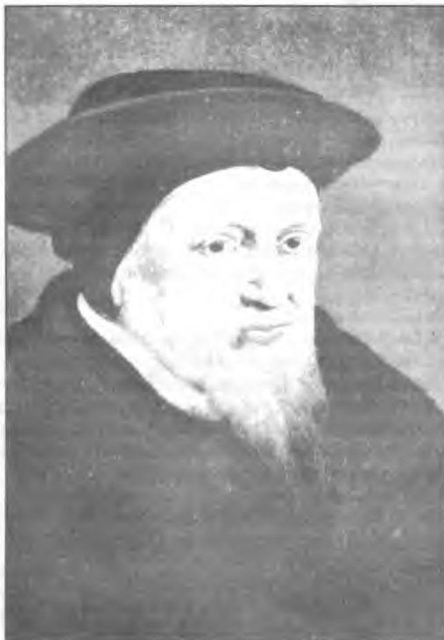
Zwingli, Svájc reformátora (Az ifjabb Holbein J. festménye után, melynek eredetije Firenzében a Galleria degli Uffiziben van)

Rilliet úgy összegezte Zwingli prédikálásának jelentőségét Máté magyarázatával kapcsolatban, hogy „a Szentírás most már úrrá lett a hagyományon”. Zwingli, a véleménye szerint pusztán emberi felfedezésektől és alkotásoktól az igazi