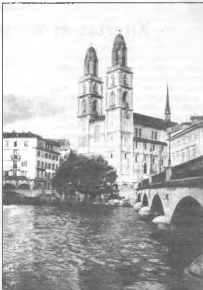
A zürichi „Grossmünster” mai állapotában (1518. december 11-én választotta meg a „Grossmünster” káptalana Zwinglit a Grossmünster lelkészévé. Ebben a templomban működött Zwingli haláláig)