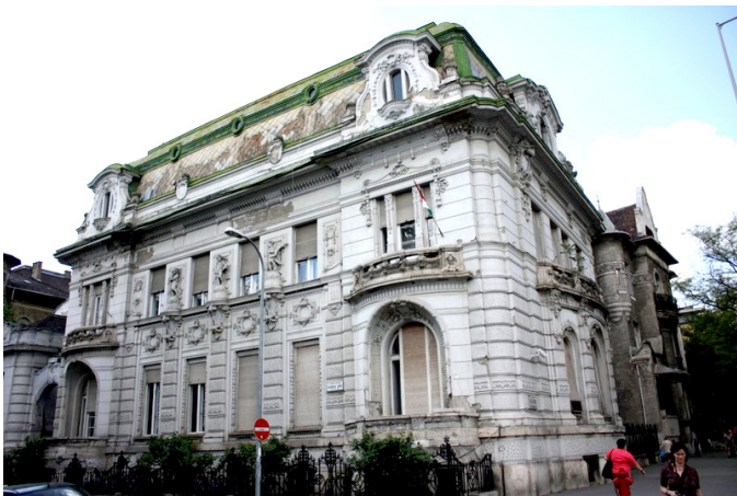
Az Állami Egyházügyi Hivatal egykori épülete a VI. kerületben, a Lendvay utca 28. szám alatt

sorolhatjuk a traktátusként kiadott nagyobb lélegzetű konferenciái előadásokat. 2 A rendszerváltásig hátralévő négy évtized nyomtatott prédikációtermése az Állami Egyházügyi Hivatal cenzúráján átesett, valójában nem is gyülekezetnek szánt, legföljebb valami hivatalos rendezvényen elhangzott beszéd volt. 3