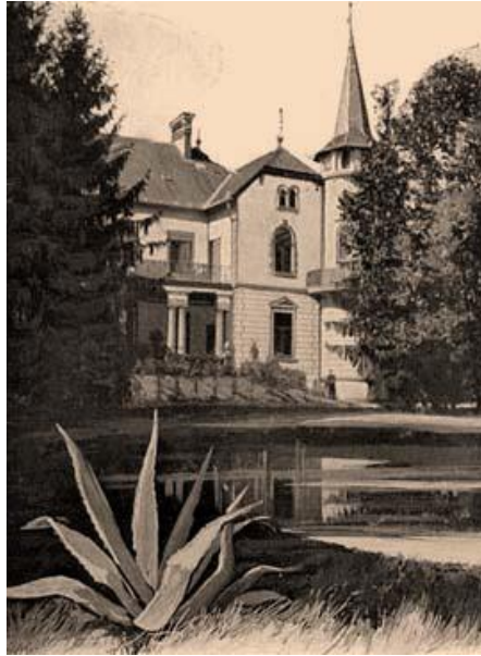
A nagyfügedi kastély. 83

A mezőgazdaság és az ipar mellett a gazdaság harmadik főágazata a kereskedelem volt, Ennek hagyományos szereplői a házaló vándorkereskedők, a szatócsok, kofák és a kupecsek, valamint maguk a termelők. Színterei az utak, a falusi vegyesboltok, a vásárok és a piacok. A települések többségében főleg a falvakban, egyelőre maradtak a mindenes vegyeskereskedések, illetve az újonnan létesített és a mérsékelt áraival konkurensként fellépő szövetkezeti hálózat, a Hangya üzletei. 84