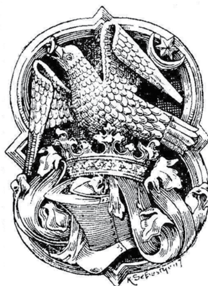
A vajdahunyadi vár kápolnájának boltzáró köve.

A magyar Hunyadi-uralkodóház székely eredetéről szóló írást a polihisztor Zágonyi Aranka György az 1811-ben megjelentetett művének címlapjára tette