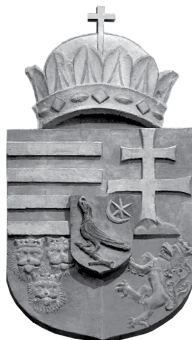
Mátyás király zárt koronás államcíme a budavári Nagyboldogasszony-templomban