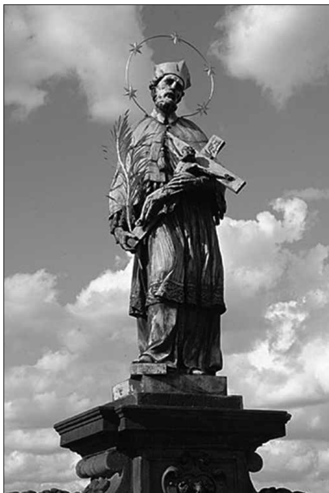
Nepomuki Szent János szobra vértanúságának színhelyén, a prágai Károly-hídon

Forrás: Královská Cesta – elektronikus oldal: http://www.kralovskacesta.cz/cs/prohlidka/objekty/socha-sv-jana-nepomuckeho_1.html (Letöltés ideje: 2021. január 18.)