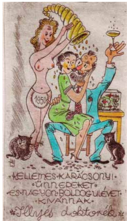
nemes Török János rézkarca, C3/3, (1950), 115×63

Sajnos nincs terünk a bemutatott grafikák elemzésére, így csak – az említetteken kívül – az alkotókat soroljuk fel: Baráth Pál, dr. Babibka Kornél, Burai István, Dombi Ákos Géza, Gonda Zoltán, Hatvani Ádám, Józsa Poppea, Máthé András, Papp Károly, Potyók Tamás. Az albumot lapozgatva összességében megállapíthatjuk, hogy kifejezőmódjában, kompozíciós