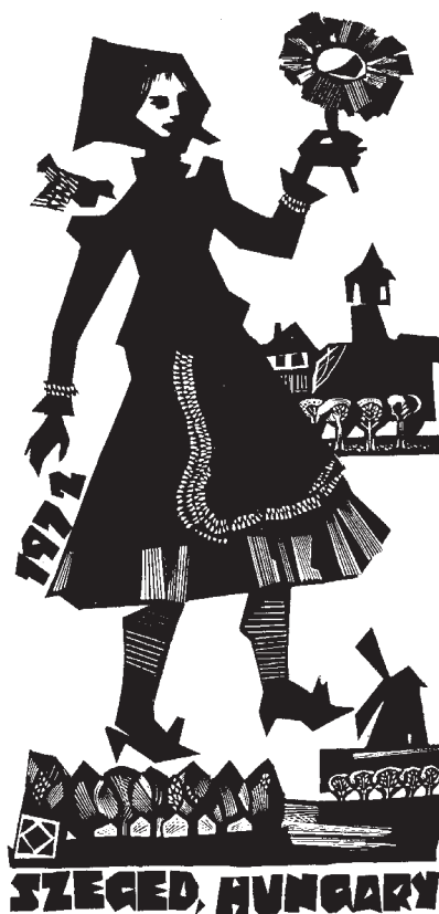
Kopasz Márta linómetszete, X3 (1972), 190×90

A gyász mellett e nagy ívű festő- és grafikusművészi pálya kimagaslóan gazdag alkotásainak megőrzése és továbbadásának súlya nehezedik ránk.