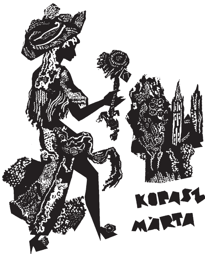
Kopasz Márta linómetszete, X3, 110×90

a bensőbből áradó szegediségevel. A Múzsák sorozatának 12 bravúros lapján teljeseedik ki, összegezve művészetének minden csillogását. Ugyanakkor ezeken a lapokon is megjelenik a Dömötör-torony, a Fogadalmi templom, az öt befogadó Egyetem és a rektorok, valamint a hűség másik jelképe, a Tisza is.