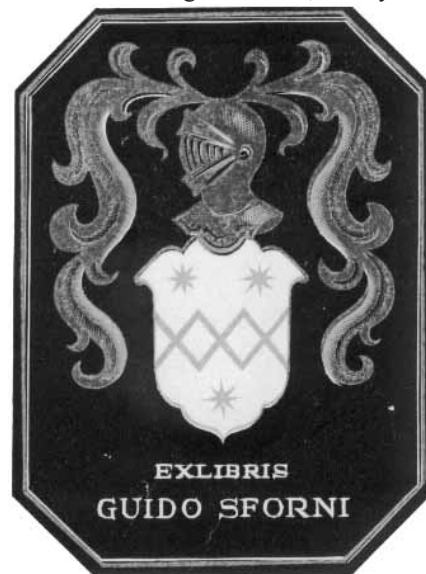
Italo Zetti grafikája

„Amikor felfedezzük az ő (Zetti) reális és álomvilágát, ugyanabban az időben nem vagyunk talán ugyanabból az anyagból, mint amiből készültek a mi álmunk?” („Aren't we perhaps made off the same stuff as our dreams are made on?”) Ez az álomszerű kivitelezés azonban egyfajta folyamatos előkészítést igényelt, értendő ez alatt az állandó rajzi tervezés, a dúcnak alkalmas fák kiválasztása és megmunkálása, és a nyomtatásra legmegfelelőbb papír kiválasztása. Ex libriseinek témaválasztása a lehető legsokrétűbb, található közöttük heraldikus vagy címeres lap, kalligrafikus hatást keltő könyvjegy, továbbá zenei, művészeti, tengeri, erotikus, szimbolikus, zodiákus, mitologikus témájú, azonkívül magángyűjtők, egyesület és közintézmény számára készített könyvtárjegyek és