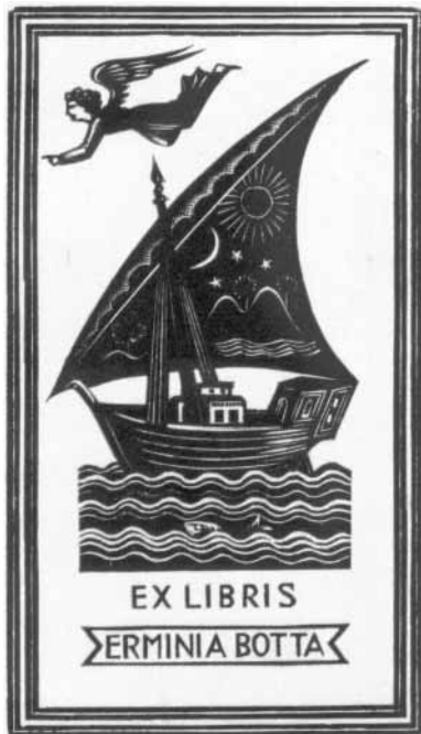
Italo Zetti grafikája

1963-tól egyre hosszabbak a Toszkánia-beli és Sestri Levante-i tartózkodásai, mígnem 1978. július 23-án a Pistoia melletti Casore del Monte kisvárosában hirtelen meghalt. Majd egy évre rá, 1979. május 14-én az Ernesta Besso Alapítvány Rómában megrendezett ex libris kiállításán Gianni Mantero így zárta Italo Zetti-ről megemlékező szövegét: „ A véleményem szerint a klasszikus ex libris utolsó művésze volt, aki azáltal szárnyalta túl mestereit, hogy olyan ötletgazdagsággal és emberi humánussal ruházta fel a metszeteit, ami semmilyen mestertől el nem sajátítható. ”