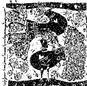
Diskay Lenke fametszetei, X2/2