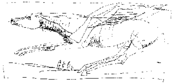
Nagy László tollrajza

1947-ben a Képzőművészeti Főiskola rajz szakának a növendéke, itt Barcsay Jenő a mestere. Vonzalma a költészethez egyre hangsúlyosabb, így a Pázmány Péter Tudományegyetem magyar irodalom-szociológia-filozófia szakán folytatja tanulmányait.