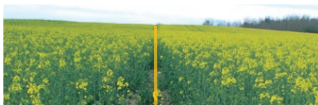
Győrvar (2017. április)

Huminisz technológia: Egy őszi és két tavaszi kezelést követően az állomány egyöntűbben és tovább virágzik.