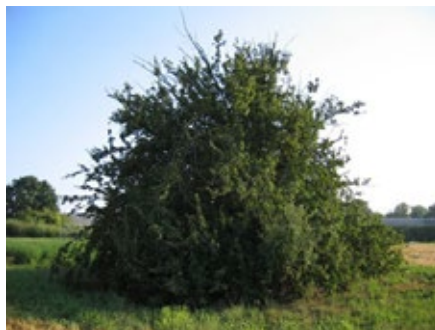
2. ábra. A „császlói som” Cornus mas f. csaszloiensis termőhelyén