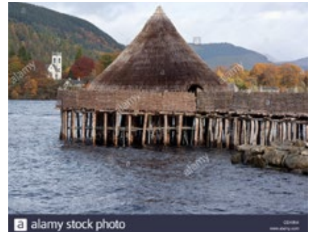
1. ábra. A svájci cölöpház

Nem megkerülhető, s lebecsülendő az a tény sem és nem érdekesség, inkább különlegesség, nagyszerűség, hogy Császlón, a Rátz-kertben, régi