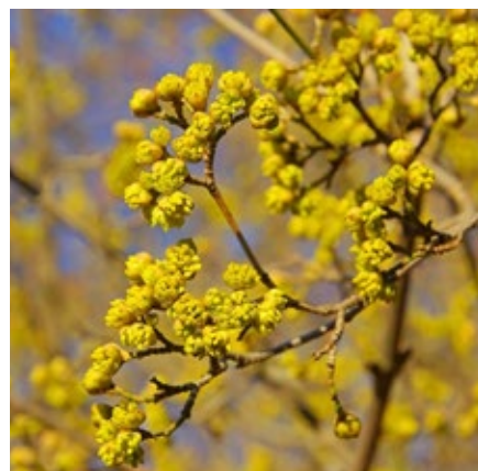
4. ábra. A császlói som virágai