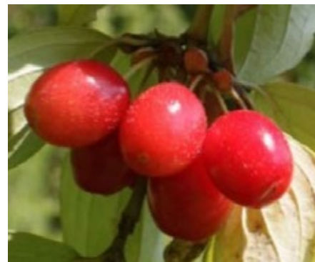
5. ábra. A Cornus mas L. f. csaszloiensis Nyékes gyümölcse