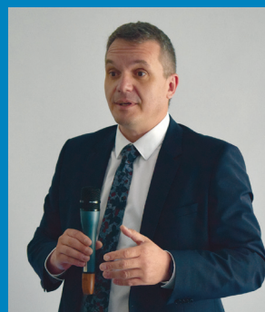
Papp Zsolt György helyettes államtitkár

A MAHOP Plusz forrása 20 milliárd forint keretösszeggel rendelkezik, aminek 30 százalékát nemzeti költségvetésből biztosítják. Az új program célja a fenntarthatóság és a versenyképesség közötti egyensúly megteremtése úgy, hogy fenntartható és innovatív megoldásokkal, a digitalizációt tartalmazva hirdessék meg a különböző pályázati konstrukciókat. Az év második felében a MAHOP Plusz éves fejlesztési keretét is több pályázatban meghirdetik, de az első körben nem az akvakultúra ágazatban tevékenykedők részére nyílik meg a pályázati lehetőség, hanem minden olyan hátér tevékenységnek, amely az operatív program működtetéséhez szükséges. Nehéz két operatív programot párhuzamosan futtatni, éppen ezért fontos, hogy az IH az ágazat szereplőivel együttműködve, pályázati menetrend összeállításával írják ki a pályázatokat.