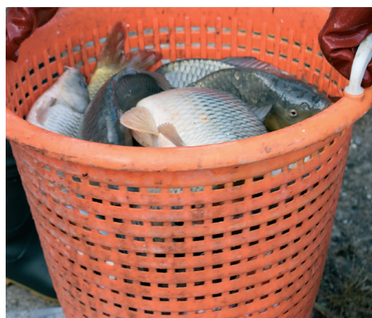
A horgászok kedvencei

A halórzés központi kérdés a szövetség számára. Jelenleg olyan sok vizet kell őrizni, hogy ez szinte lehetetlen feladatot a szervezet 13 hivatásos halórének, hiszen majdnem 2 ezer hektárról van szó. Maga a főág 58 kilométer, de teli van mellékággal,