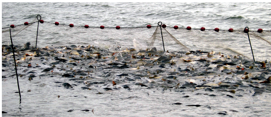
A lehalászás ma is hasonlóan történik, mint a 16. században

Földművelésügyi Minisztérium Horgászati és Halgazdálkodási Főosztály