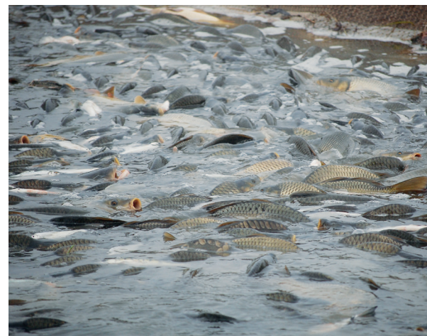
Egészséges a ráckevei pikkelyes ponty