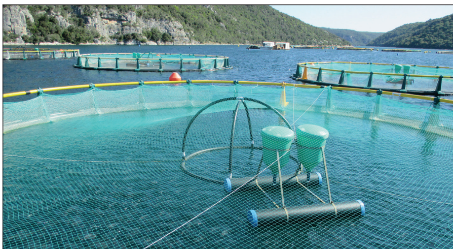
Ketreces haltenyésztés a Limski csatornán

Az rt.-nek 300 tonna/év piaci halmenyiség megtermelésére van engedélye. Az üzemből a keltetéstől – a feldolgozást is beleértve – 300 fő dolgozik. A 65 ketrec ivadékkeltését a cégen belül, saját keltető-