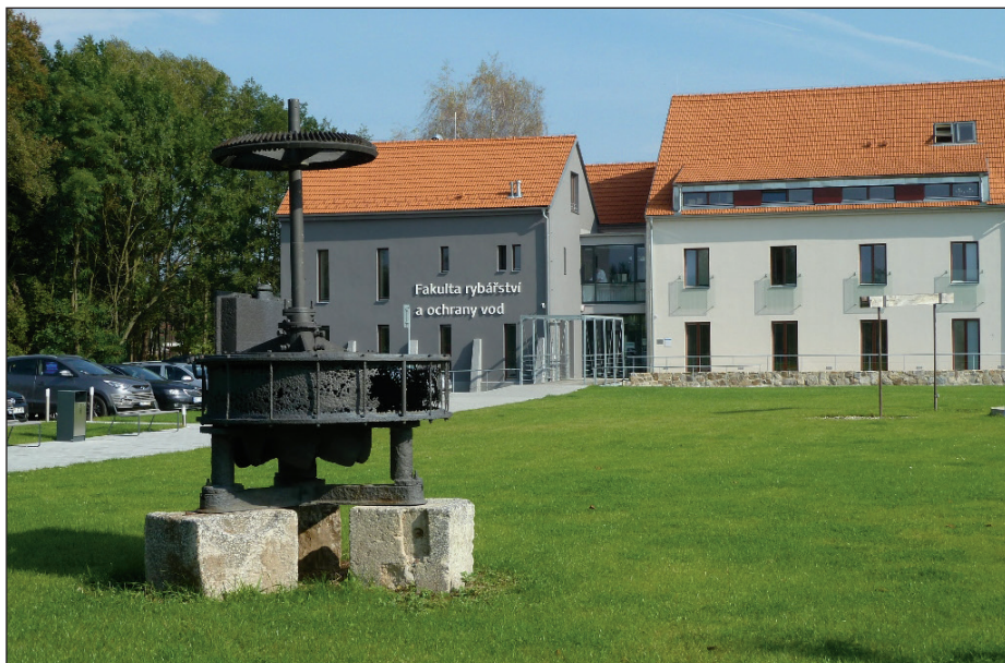
A konferencia helyszíne, a Dél-Bohémiai Egyetem Halászati és Vízvédelmi Tanszékének Oktatási és Informatikai Központja Vodnanyban