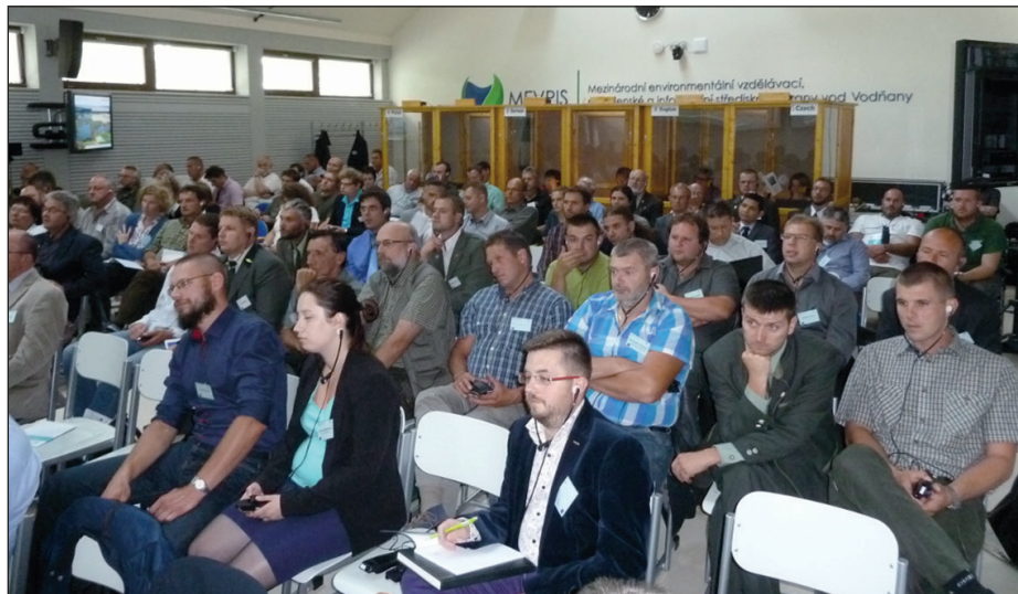
A konferenciaterem csaknem kicsinek bizonyult a több mint száz résztvevő befogadására

A nyilatkozatban is rögzített, általános megállapítása volt a III. Nemzetközi Ponty Konferenciának, hogy az édesvízi tógazdálkodás az európai akvakultúra egyik kihasználatlan lehetősége, ráadásul a már felismert lehetőségek kihasználása is lassú, és a termelés stagnál. A hagyományos rendszerek és technológiák alkalmazása, és következként a hagyományos termékek (mint pl. az élő hal) értékesítése még mindig meghatározó az édesvízi tógazdálkodásban. A vadon élő hablevő állatok kártételei és a gyakran következetlen és indokolatlanul korlátozó szabályozások, illetve más külső tényezők is gátolják az ágazat fejlődését. A külső tényezők között említhető a klímaváltozás, illetve a haltermelők diszkriminációja a mezőgazdasági termelőkhez képest, továbbá az innováció