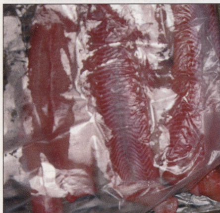
Az afrikai harcsa szállításra vár

Egy kihelyezett elnökségi ülésnek olyan üzenete is van, hogy az elnökség tagjai megismerik a vendéglátók gazdaságát, helyzetét. Ez történt Tiszacsegén, is, ahol az ülés