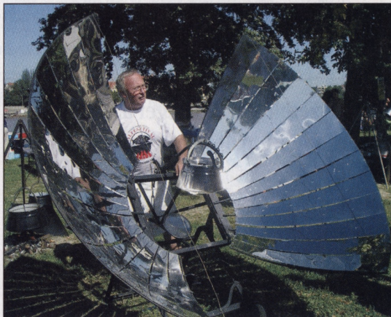
Napelemes bográcsot láthatott a Tisza-parti közönség

A sátrak között járkalva rábukkanok egy érdekes feliratra: Belvárosi Római Katolikus