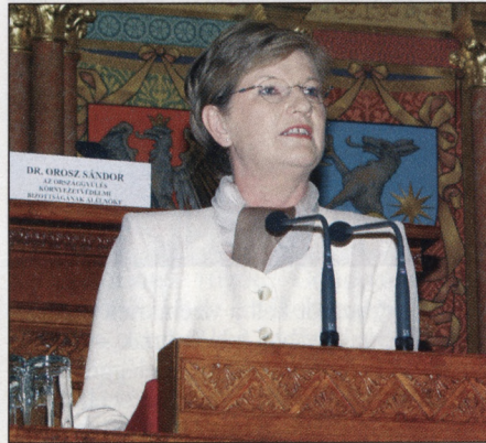
Dr. Szili Katalin házelnök

Dr. Szili Katalin házelnök köszöntőjének elején gyorsan leszögezte, mind a halászokkal, mind pedig a horgászokkal szimpatizál. Fontos, amit Önök tesznek, hangsúlyozta, hiszen két civil közösség tárgyalja meg egy ágazat, egy sportág, egy hobbi, egy rekreációs tevékenység közös gondjait. Az Országgyűlésnek is van horgásztagozata, ami jelzi, hogy a képviselők között is sokan hódolnak e kellemes szabadidőtöltésnek. Tény, hogy