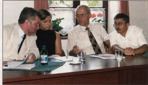
A lengyel delegáció