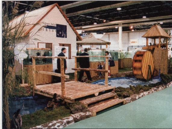
A 2000-es OMÉK halas standja

Már 2000-ben is kirobbanó sikere volt a nagy medencében úszkáló óriásharcsának, melynek kiállítása továbbra is a tervek között szerepel. A különböző halfajok 26 db akváriumban és 2 db medencében kerülnek elhelyezésre a halászat ősi mesteriségét megjelölő dekoratív környezetben.