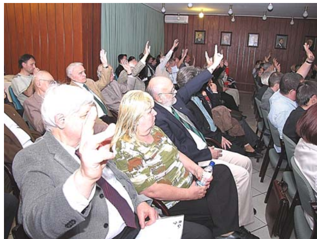
A tisztelt közgyűlés szavaz

A Titkár ezután ismerteti a Magyar Geofizikusok Egyesületének 2012. évi pénzügyi tervét. Erre az évre is a szokásos