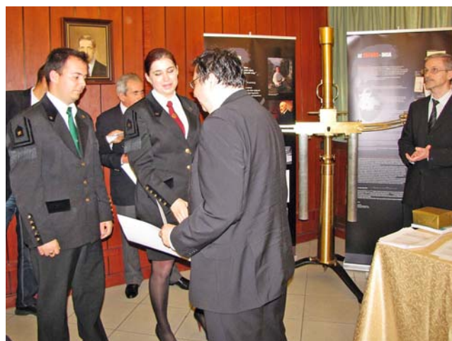
Az ISZA-díjak kiosztása