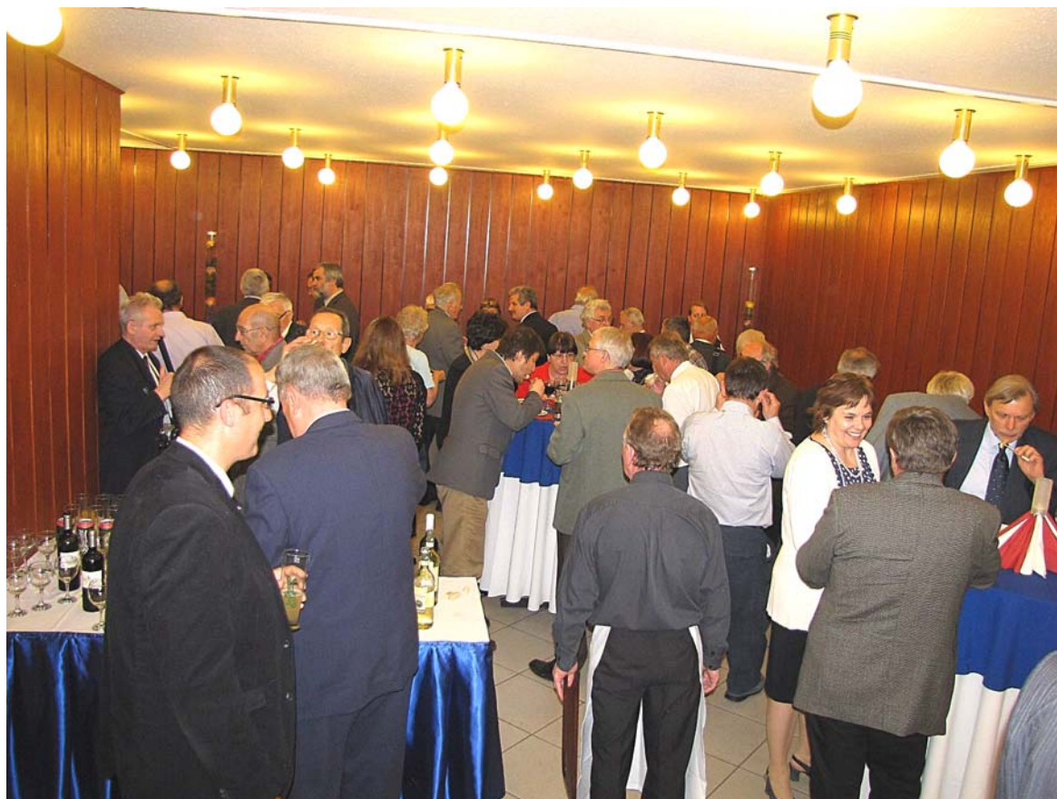
A közgyűlés jó hangulatú befejezése állófogadással

elemoxidkoncentráció-értékek eloszlásának statisztikai vizsgálata” c. munkájáért ( Magyar Geofizika 52/2, 62–78).