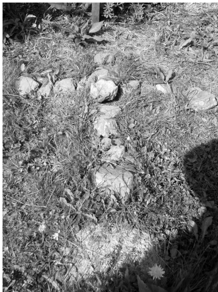
Kőből kirakott kereszt, 2006

„Bicskával a fenyőfáknak a kérgibe bele volt vésve, hogy »Éljen a magyar szabadság, éljen a székely nép, éljen a magyar nemzet!« Olyan magasra volt bicskával belevésve, s utána az ágakat levágta az a valaki, hogy ne lehessen eltüntetni.”