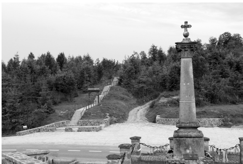
Nyergestetői emlékoszlop, 2016