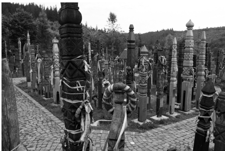
A nyergestetői temető kopjafás korában, 2016

Korábbi kérdésemre, hogy Mikor állította és ki az első kopjafát? , egyértelmű választ ezúttal sem kaptam. Adatközlőim többsége úgy tudja, hogy a '89 utáni fordulat nyomán. Adataim rendszerezése, időrendbe állítása egy megdöbbentő feliratot hozott elém: Lelkiismeret 1988 . Ez a felirat újragondoltatta az ágkeresztes temető történetét és a székely katakombá-állapot cezúrájának éreztem. Valaki legyőzte magában a félelmet, nevét még nem adta hozzá, de belső lelki energiáját, vívódását megnevezte. Nem egy ember állította az első kopjafát, hanem a fölėje emelkedő LELKIISMERET.