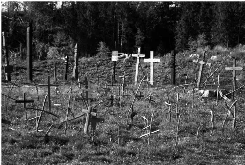
Ágkeresztes temető, 2003

A környék falvaiban – Kozmáson, Lázárfalván, Szentmártonban, Kászonban – senki sem tudta megmondani, hogy ki lehetett az első, aki ágkeresztet szúrt le. Csak annyit tudtak, hogy: „Mikor arra jártunk, belopakodtunk, bicskával rést vágva a bozóton, leszúrtunk mi is egy keresztet, gyertyát gyújtottunk, elmondtunk egy imát, s mentünk tovább.”