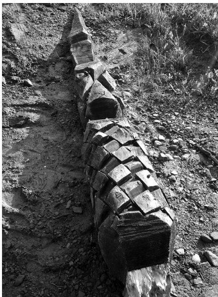
Élő kopjafa Nyergestetőn, é. n.