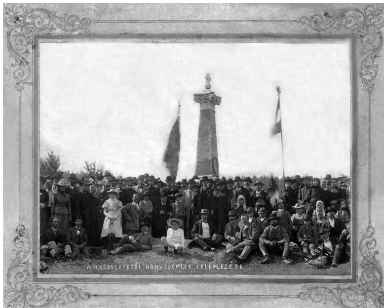
Korabeli fénykép az avatásról