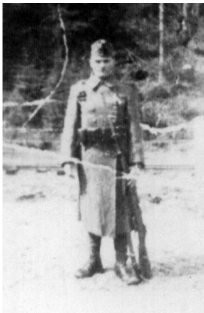
Az édesapa katonakori fényképe

a csajkája, amivel merte a vizet. A víz csobogásától észre sem vette, hogy ott van mellette az ellenséges katona. Amikor észrevette, kapott is a golyószórója után, de az apám a fegyverével mutatta, hogy nana! Aztán azt is lemuto-gatta neki, hogy töltsé teli az edényét, és elmehet, nem fog rá-lőni. Úgy is lett, az orosz vette a teli bidonját, és elment. Akkor odament az apám, ő is mert vizet, majd indult vissza. De ez még mind semmi. Igaz, fölöttük repültek a golyók, de amikor fölért, megfagyott benne a vér. Mind a négy társa halott volt. Találat érte az üteget, az oroszok bemérték, és ki is lőtték az ellenséges állást. De lám, szerencséje volt, megkímélte