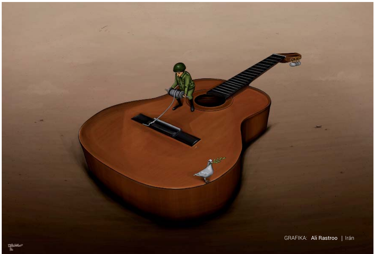
GRAFIKA: Ali Rastoo | Irán