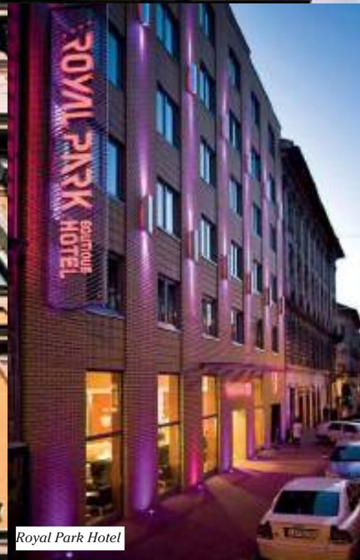
Royal Park Hotel

Marosi Miklós definíciója szerint az építészet egy olyan művészeti ág, amelyiknek a művészeti mivoltát általában inkább az utókor szokta tudatosítani és elismerni. „Nagyon furcsa dolog, amikor kortárs kollegák művészként járnak-kelnek a világban, holott még nincsenek arról meggyőződve, hogy az általuk létrehozott alkotás az örökéletű lesz, vagy legalábbis az utókor számára megbecsülendő.”