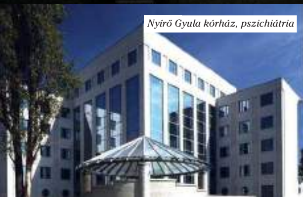
Nyíró Gyula kórház, pszichiátria