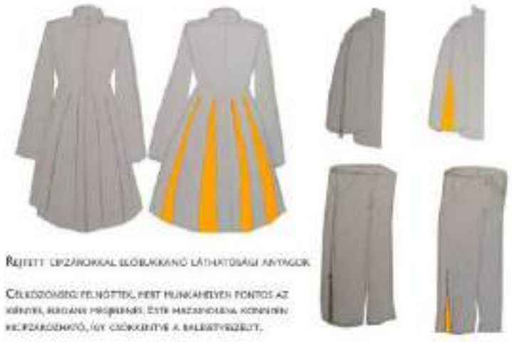
REJTETT ZIPÁRORKAL ELŐBUKKANO LÁTHATÓSÁGI ANYAGOK

CÉLKOZÁS: FELNŐTTEK, PÉNT MUNKAHELYEN FONTOS AZ KÖNYEL, BUDAPESTI PROJEKTUS. ESTE HAZÁNGYŐRÖK KÖZTÁRSASÁGÁNAK, ÍGY CÉLKOZTATVA A BALESETVEZÉST.