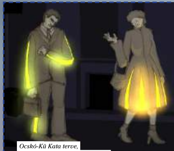
Ocskó-Kü Kata terve

Megdöbbentő a száma a közlekedési baleseteknek, nemcsak globális, de hazai vonatkozásban is: a magyar utakon évente átlagosan hatszázán halnak meg, és több mint húszezren sebesülnek meg közötti baleset során, októberben 71, novemberben lapzártáig 37 személy vesztette életét közlekedési balesetben. Ennek pszichológiai felmérésekkel is alátámasztható oka az,