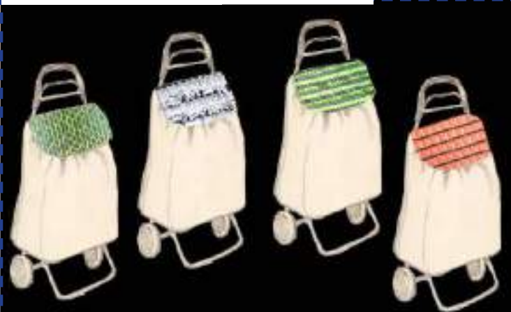
Juhos-Kiss Csenge terve