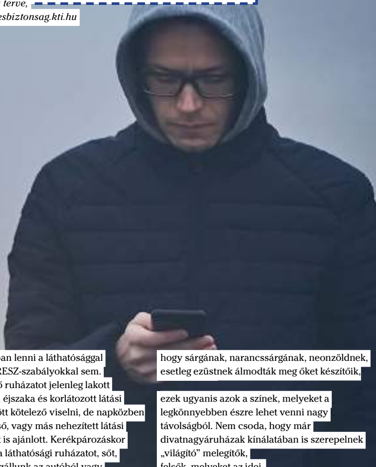
Ocskó-Kü Kata terve

Nem árt tisztában lenni a láthatósággal kapcsolatos KRESZ-szabályokkal sem. Fényvisszaverő ruházatot jelenleg lakott területen kívül, éjszaka és korlátozott látási viszonyok között kötelező viselni, de napközben hóesés, köd, eső, vagy más nehezített látási viszony mellett is ajánlott. Kerékpározáskor viselnünk kell a láthatósági ruházatot, sőt, akkor is, ha kiszállunk az autóból vagy rákényszerülünk annak tolására. Nem írja elő azonban azt a szabályzat, hogy lakott területen belül fényvisszaverő mellényt viseljünk, még akkor sem, ha nincs közvilágítás. Persze, ha fokozni szeretnénk a biztonságunkat, ilyen esetben is tegyük magunkat láthatóvá.