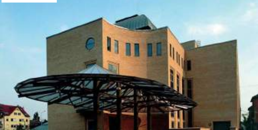
Uzsoki utcai kórház