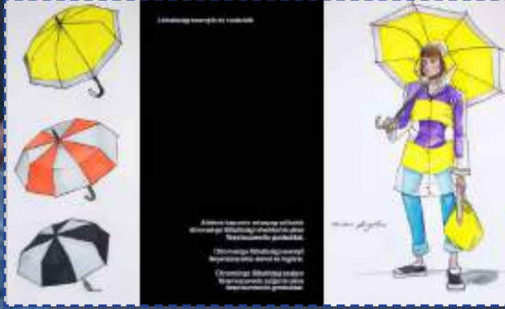
Vizsolajszky Kira terve