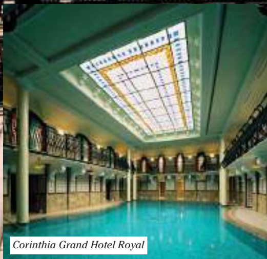
Corinthia Grand Hotel Royal