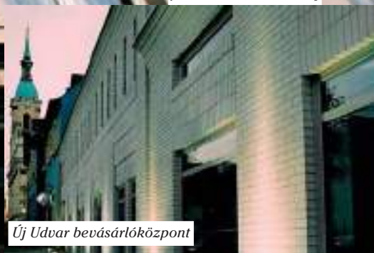
Új Udvar bevásárlóközpont