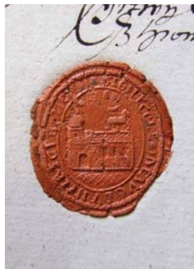
3. kép. A gyülekezet pecsétje 1783-ból