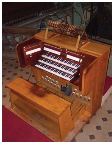
10. kép. Az orgona mai játszóasztala