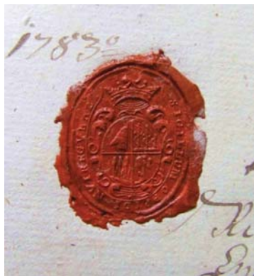
2. kép. Nyíregyháza város pecsétje

II. József türelmi rendelete értelmében a gyülekezet végül 1783-ban megkapta az engedélyt egy új templom építésére. Az alapkövetétel 1784. március 24-én megtörtént, s a két és fél évig tartó építkezést követően 1786. október 22-én fel is szentelheték két végigmenő oldal- és egy orgonakarzattal kialakított templomukat. (2–3. kép)