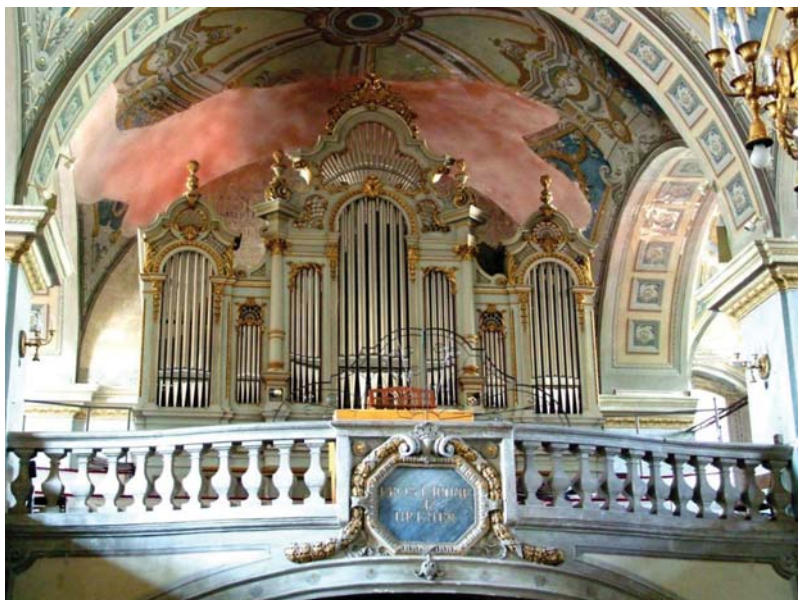
8. kép. Az orgona homlokzata

kötött, amelynek évi 90 koronás díja helyett 1917-ben óránként 4 K-ra [!] kérték módosítását. A módosítás után szeptember 29-én be is terveztek 1200 K-s javítási költséget, a javítás azonban csak 320 K-ba került. 83