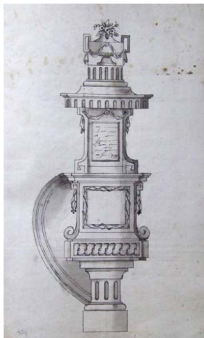
4. kép. A templom szószékének rajza

A felszentelt templomot a padokon kívül azonban oltárral, szószékkal (4. kép), gertyatartó csillárokkal és orgonával is el kellett látni. A templom felépítése után csak 10 évvel később, 1796-ben került sor a méreteihez igazodó orgona megrendelésére. Nem tudjuk biztosan, hogy az imaházból hozták volna át orgonájukat, de a templom építése kapcsán ilyen kiadásra nem akadtunk. Annyi azonban bizonyos, hogy az új orgona építője mérlegelte, hogy a régi orgonából mit tud felhasználni az új hangszer készítésénél. A gyülekezet Emanuel Kummer nagyvárad-i orgonaépítővel 6 kötött szerződést egy 25 regiszteres 7 orgona megépítésére. Ez az orgona azért érdemel kiemelt figyelmet, mert az akkori Magyarország evangélikusainak egyik legnagyobb orgonája volt. 8 A teljes egészében II. József türelmi rendeletét követően épült orgonák közül építéskor viszont ez volt a legnagyobb evangélikus templomi hangszer. A legnagyobb evangélikus gyülekezeteknek (Szarvas, Békéscsaba, Győr, Tótkomlós, Orosháza, Mezőberény, Lócse, Besztercebánya, Nagyvárad, stb.) 9 ekkor még mindenhol kisebb orgonájuk volt. Ez alól kivétel Erdély szász területe, ahol ezidőtájt Nagyszebenben és Brassóban volt nagyobb orgona. A nyíregyházi Nagytemplom orgonája a környék evangélikus templomainak orgonáihoz képest viszont kiemelkedően nagy hangszernek számított.