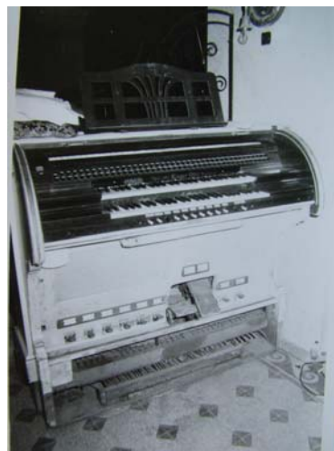
9. kép. A Rieger-orgona pneumatikus játszózástala

Ez az átalakítás átmenetileg előrelépést jelentett, de elsősorban a hangfekvések vonatkozásában és az orgonahangversenyeken felhangzó művek választékosabbá válása kapcsán. Az átalakítások ellenére az orgona hangszínei azonban nem hozták meg a várt eredményt, s továbbra is csak alig volt alkalmas a polifon zene játszására, 103 elsősorban a hangszer pneumatikus traktúrája miatt (9. kép).