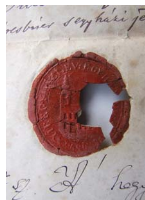
16. kép. A gyülekezet pecsétöredéke 1876-ból

Huszonhárom évesen, 1876. november 4-én Nyíregyházán kötött házasságot a 18 éves Nádasi Emiliával, 161 mely frigyből 5 gyermekük született: Dezső (*1877.