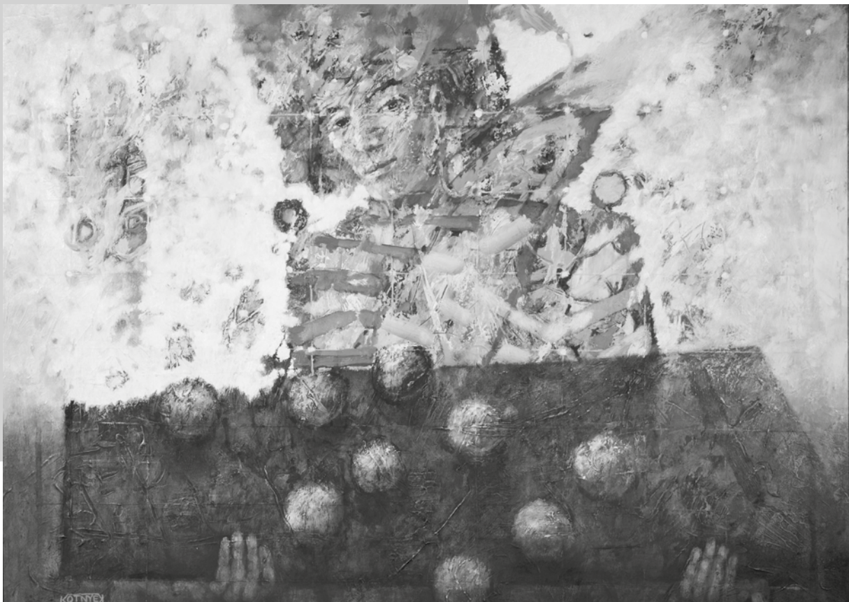
KOTNYEK ISTVÁN: Kílences

Szemadám György kiváló ismertetőjében említi, hogy Kotnyek István fittyet hány az aktualitásokra, de ezt inkább csak úgy lehet értenünk, hogy nem jelenkori művészetpolitikai megfontolásokat, divatokat, trendeket, ízlésvilágokat követ, hanem az aktuális világ aktuális problémáit jeleníti meg képein, sok-sok áthallással, utalással. Tárlata, s egész művészete igazi intellektuális csemege, ami most élvezhető leginkább, frissen, Nagykani- zsán, a Magyar Plakát Házban.