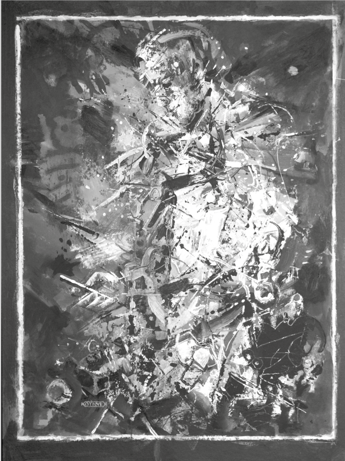
KÖTNYEK ISTVÁN: Darkline