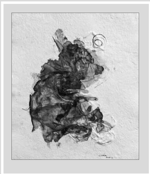
CSURÁK ERZSÉBET: Sodrás, 2019 (K.Cs.)