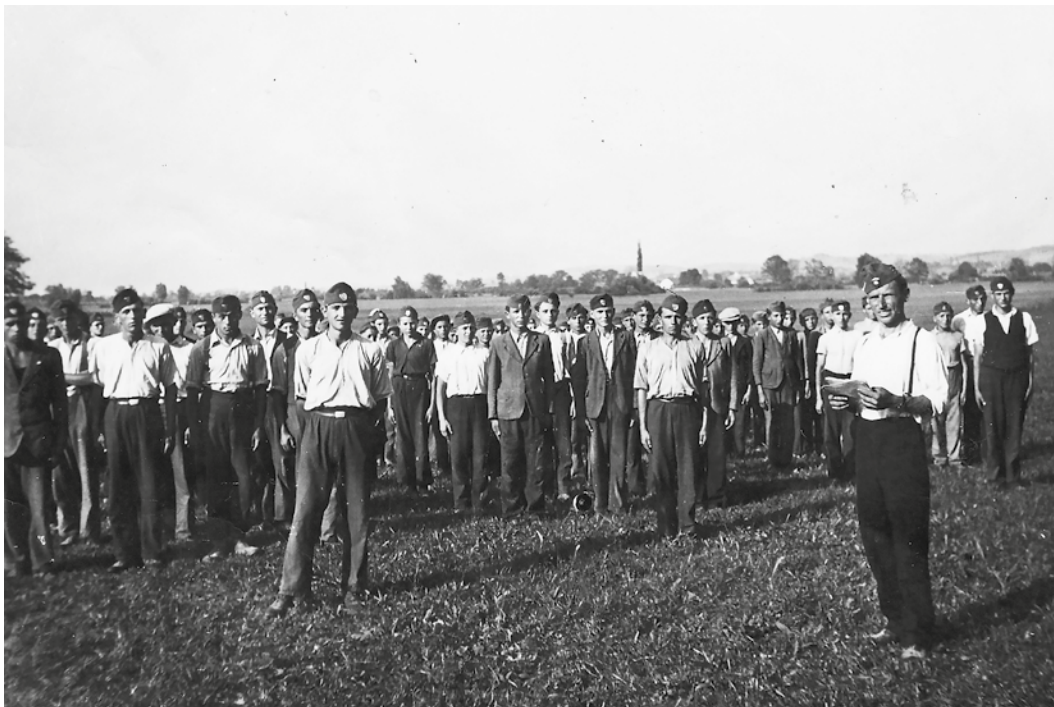
Zalai leventék oktatójukkal az 1940-es évek elején

telműen megfogalmazta a „testkultúra militarizálását”. 3 A kibontakozó levente- oktatásba tudták vonni a korábban a hadseregben szolgált tiszteket, altiszteket, illetve a vidéki településeken a tanítókat, sőt a jegyzőket is, és 1927-től már egyértelműen a katonai előképzés lett a fő feladatuk.