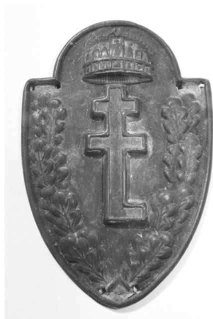
Levente sapkajelvény

A kialakuló mozgalmat az Országos Testnevelési Tanács koordinálta. Az 1924 januárjában kiadott 9000/924. VKM rendelet már egyér-