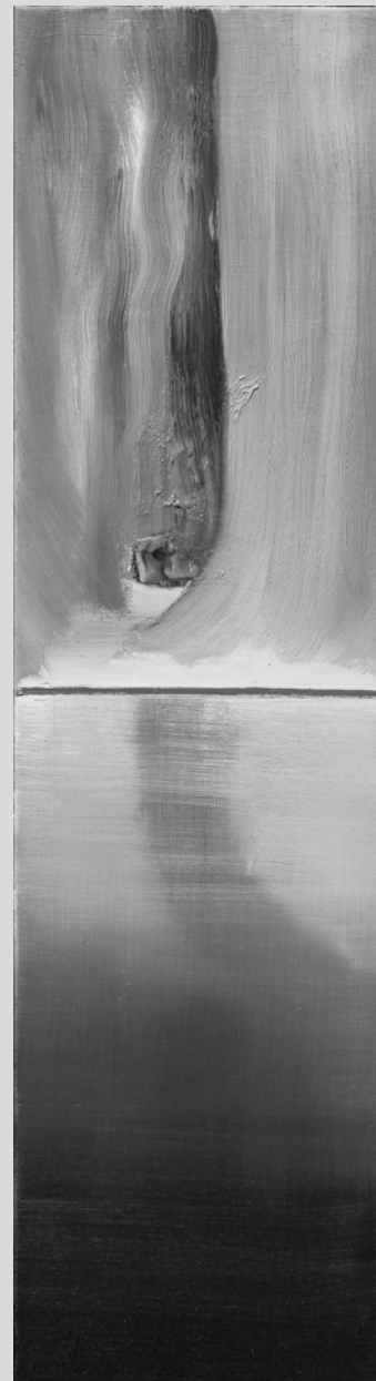
GESZTELYI NAGY ZSUZSA: Tükröződés 2021