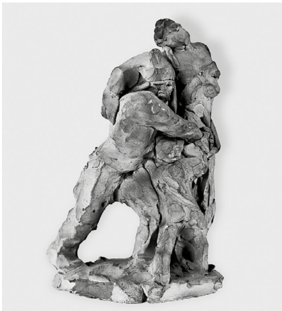
Észak szobra vázlat, 1921, GM.1976.3.153.

alatt a mögötte lévő kereszt szára látszik, s ennek tetejére támaszkodik alélt, csukott pillájú feje is. Szétszagatott, keblét csupaszon hagyó ruhája ernyedt redőkbe rendeződve omlik alá vállairól. A csizmát, szűk nadrágot, zsinóros mentét viselő kuruc a – nőalak előtt elnyúlva – csupasz kardjára támaszkodik. A Hungáriát ugyancsak nekifeszülve támogató tót fiú az ő karjának és testének íve alatt áll, felsőteste túlzott csavarodásával arca visszafelé tekint. Lépésének iránya ellentétes a vitézével, s ehhez felsőtestük ellentétes irányú csavarodása is járul, ami a csoportozatnak sajátos belső dinamizmust kölcsönöz. A két alak ugyanakkor határozottan egy irányba néz, ezzel tesznek hitet a közös jövő mellett.