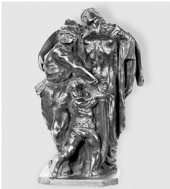
Észak szobra kismintája, 1921, GM.1976.3.152.

Az alkotásnak szintén a Göcseji Múzeumban őrzött, korábbi agyagvázlatán Hungária mögött még nem volt kereszt, a most felemelve erre támaszkodó bal karja testéhez simult, a fején lévő főveg hiányzott. A kart, a róla lecsüngő drapériát, a kereszt szárának végét, a hosszú ruha alól kilátszó lábfejet és a sapkát Strobl utólag, viaszból alakította ki és toldotta a szoborhoz. A változtatás révén ennek arányai megváltoztak, az egész szélesebb lett. A csak hátulról látható kereszt a körüljárhatóságot, a töbnézetűséget erősítette, egyben bővítette az allegorikus narratívát is. A végleges mű a kiegészített vázlatához képest az arányoknak a bal kar további megemelése révén a szélesség javára történő módosításától és a részletek kimunkálásától eltekintve nem változott: a mozdulatok bonyo-