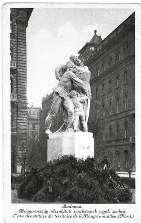
Budapest, Észak szobra, 1921.