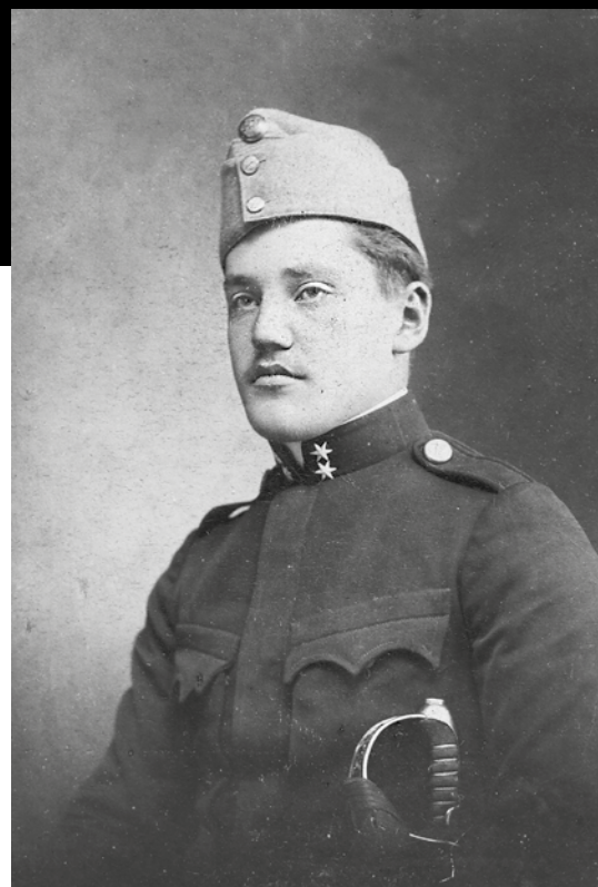
Egyévi önkéntes tizedesként 1914-ben