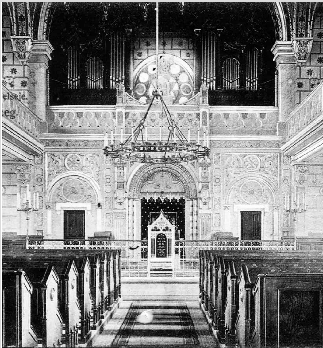
A zalaegerszegi zsinagóga 1910 körül, a háttérben az orgonával

Szemedbe ötlik a méretbeli átalakulás: hat regiszter, nyolc, tíz, huszonhat, lehetett volna negyvennégy, helyette kilenc, majd tizenhat, egykor volt és fiktív sípsorok visszhangzanak az évszázadok között. Hangjuk mára elmosódott, mint merített papíron a vízáztatta tinta; félmondatokból, elejtett számokból, emlékfoszlányokból áll össze a Mária Magdolna Plébánia-templom orgonáinak története. Folytatása következik, laudate eum in chordis et organo.