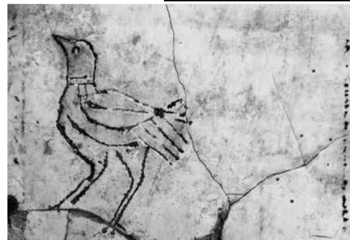
BUDAHÁZI TIBOR: Római töredék 2019

Sok helyen fotózhat az ember utcai töredékeket, de azok egy kicsit mindenhol mások. Róma egy több évezredes város, amely az ókori világ legnagyobb, legnépesebb, milliós metropolisa volt és bár akadtak évszázadai a középkorban, amikor lakossága néhány tízezresre apadt, kultúrája, színessége és centrum-jellege sosem szünetelt, tehát szinte minden ott hever