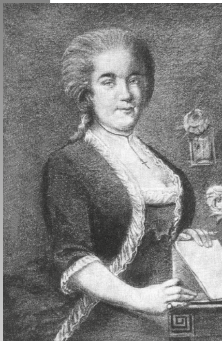
DEÁK GÁBORNÉ HERTELENDY ANNA egy korabeli festményről készült reprodukción az 1770-es évek végén